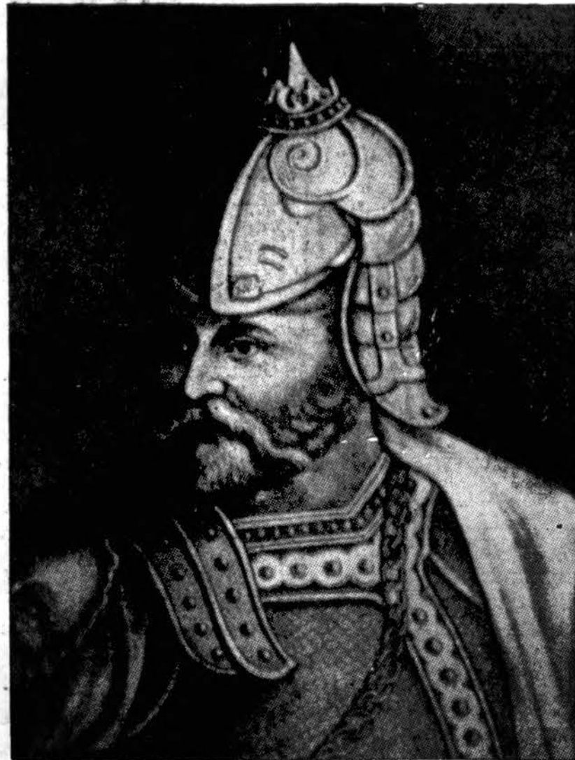
Didysis Lietuvos Kunigaikštis Gediminas, kuris 1315 metais užėmė Lietuvos valdovo sostą, gražioje Neries ir Vilnelės tarpkalnėse įkūręs Vilnių ir iš Trakų perkėlęs Lietuvos sostinę. Ilgai buvęs svetimųjų pavergtas Vilnius vėl atgautas ir spalio 17 d. į jį įėjo Lietuvos kariuomenė.

Pagaliau darbininkai kreipė teisman ir šis įsakė surengti unijos suvažiavimą.