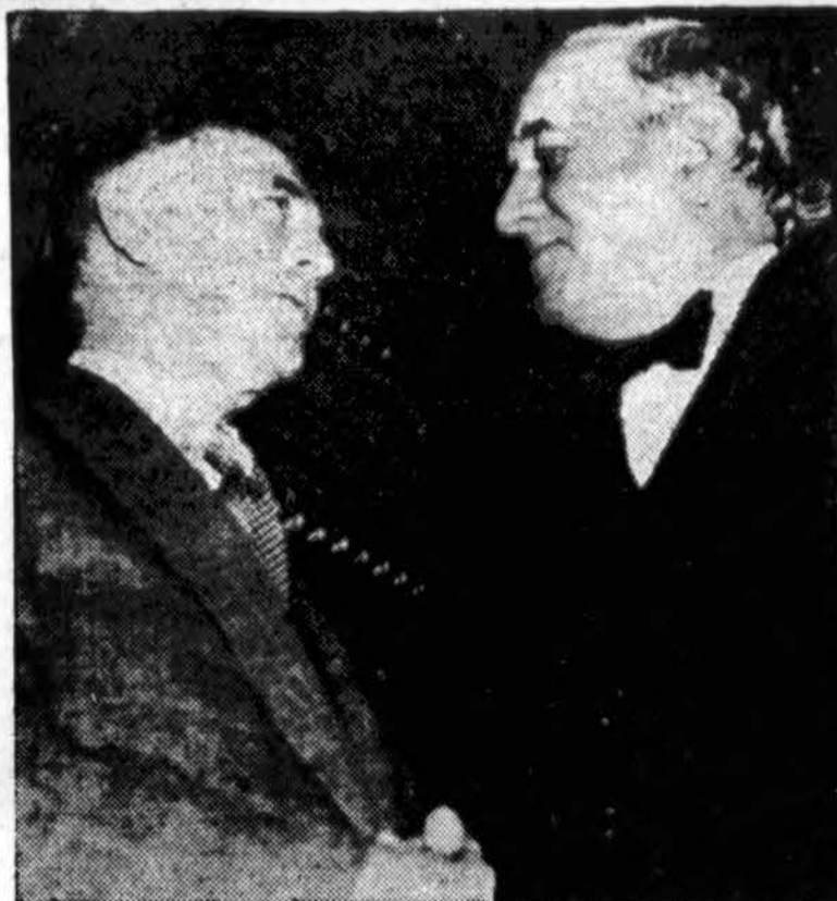
Senatoriai Key Pittman ir Tom Connelly, padėję sureduoti vadinamą "Cash and Carry" biliu, sveikinas, kuomet tas bilius senate perėjo 63 prieš 30 balsais.

Viso veikia 108 tribunolai. Jie įsikūrę įvairiausiose vietose, labai daug tiesiog mokyklose arba klebonijos salėse. Visa eilė tribunolų veikia tik vienoje Londono apylinkėje, vadinamame Hampsteade: čia gyvena net ketvirta dalis minėtų svetimšalių. Tai labai turtingas rajonas. Gražūs namai, daug alėjų, sodai. Šv. Jono bažnyčios namuose, didelėse salėse, posėdžiauja tribunolai. Vienos bylos nagrinėjimas trunka 10-15 minučių ir todėl per dieną pereina 35-40 asmenų. Teisėjas po ranka turi kiekvieno teisiomojo dossier arba "gyvenimo bylą", kurią iš anksto yra paruošęs Scotland Yardas. Bet galutinas sprendimas pareina nuo teisiomojo parodymų. Kartais "teisiomas" asmuo atveda liudininkus. Jais būna angļai, kurie aiškina, kad jų pažįstamas svetimšalis yra tikras pabėgėlis arba kad, jeigu jis dar