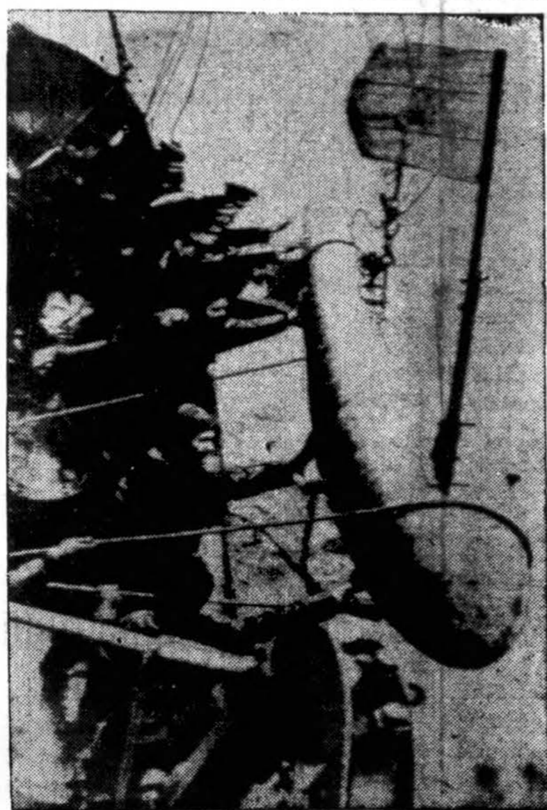
Britų karo laivo minų pašalintojo igula įeidžia jūron plūdę, kuriaja nužygnama prieš panardytą povandeninį miną, kad kiti laivai saugotusi tos vietos iki mina bus sunaikinta.

MASKVA, spal. 29. — Sovietų oficiali žinių agentūra Tass praneša, kad lenkų valdytos Ukrainos dalies nacionalinis susirinkimas Lvove