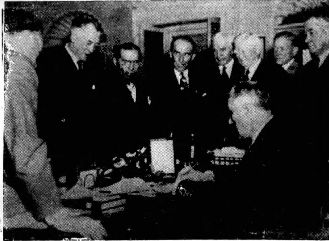
Prez. Roosevelt pasirašo neutralumo aktą, kurį perleido kongresas.

Atsikėlus buvo beveik vidudienis. Aplink joks garsas nedarėmstė liūdno laukų tylos. Vaelas Šnaffas išalko. Pradėjo žiovauti ir mąsto apie dešras, kurias duoda kareiviams. Atsikėlė, pastebėjo jog labai silpnas, vos gali paeiti. Atsėdo ir vėl galvojo apie ką tik praėjusius įvykius. Paskui atėjo jam labai praktiška mintis: pažiūrėti, gal, kartais koks kaimietis praeitų pro šalį, tada jis galėtų pribėgti ir pasiduoti. Padėjo geležinį šalną ant žemės, iškišo galvą, žvalgydamas ar neina koks žmogus. Nieko nematė, gi dešinėje pusėje matė mažą kaimelį, kuriame iš vieno namelio kamino vertės dūmų kamuoliai. Kitoj pusėj, alėjos gale, pamatė labai didelį prancūzišką namą. Pasiryžo laukti iki vakaro alkdamas, nieko nematydamas kaip tik lekiančias varnas, nieko negirdėdamas kaip tik gurguliavimą savo vidurių. Atėjo naktis, ir Vaelas vėl išsitiesė ant žemės, ir vėl užnigo, bet jo miegas buvo alkstančio žmogaus miegas, pilnas baimės ir neramumo.