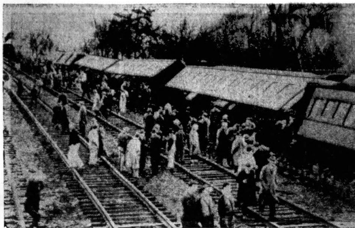
New England State Express, kursuojas tarp Chicago ir Boston, netoli Westfield, Mass., nušokęs nuo bėgių. Sužeista keliolika keleivių.