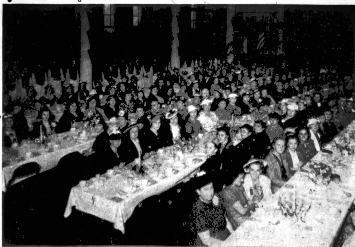
20-tasis Š. K. AKADEMIJOS RĖMĖJŲ SEIMAS

"DRAUGAS" 2334 So. Oakley Ave CHICAGO, ILL.