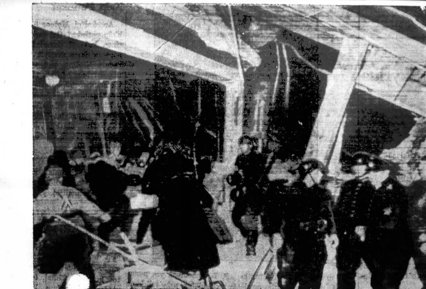
Buergerbrau alinė, Miunchene, po sprogimo bombos, kuria norėta nužudyti Hitleris. Policija ir smogikai daro kratą ir suima kiekvieną įtariamą.