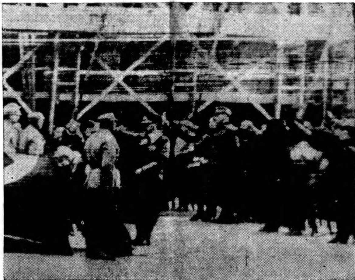
Hitleris (kairėje nuo centro) dalyvauja žuvusiųjų nuo bombos sprogo nacių laido-tuvėse Miunchene. Jis salituodamas pagerbia žuvusiuosius.

CANBERRA, Australija, lapkr. 13. — Australijos vyriausybė paskelbė, kad ji sudarėsi sau pagelbinį karo kabinetą, kurs padės vyriausybei valstybės saugumo darbuose.