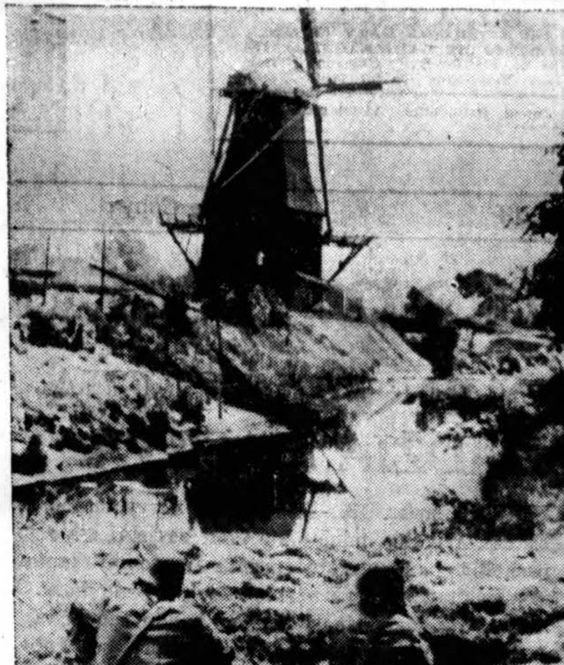
Pastaromis dienomis Olandųj buvo baimės, kad vokiečiai gali įsiversti ir pasmaugti krasto nepriklausomybę. Nuo-trauktoj Olandijos kareiviai saugo Olandijos - Vokietijos sieną.

Nors negalime pasidžiaugti kad Amerikos lietuviams katalikams nebūtų žinomi divorsai, nes jau tokių turime, bet jų nedaug yra katalikų tarpe. Dažniau girdime apie įtemptus šeimose vyro ir moters santykius, apie vaikų neklusnumą ir skaudžius tėvams nepagarbos pareiškimus. Bet visa tai dažniausiai pasitaiko tose šeimose, kur tikėjimo reikalai apleisti, kur šeimos na-