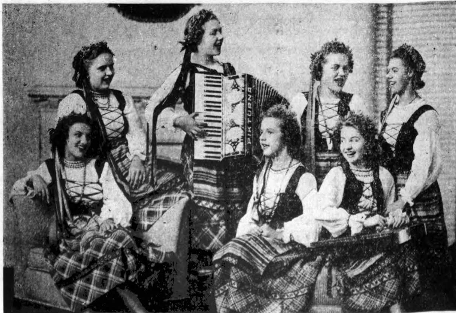
ŠV. KAZIMIERO AKADEMIJOS RINKTINIS CHORAS

Su kiekvienu $5.00 skelbimu gausite vieną tikieta į bankietą.