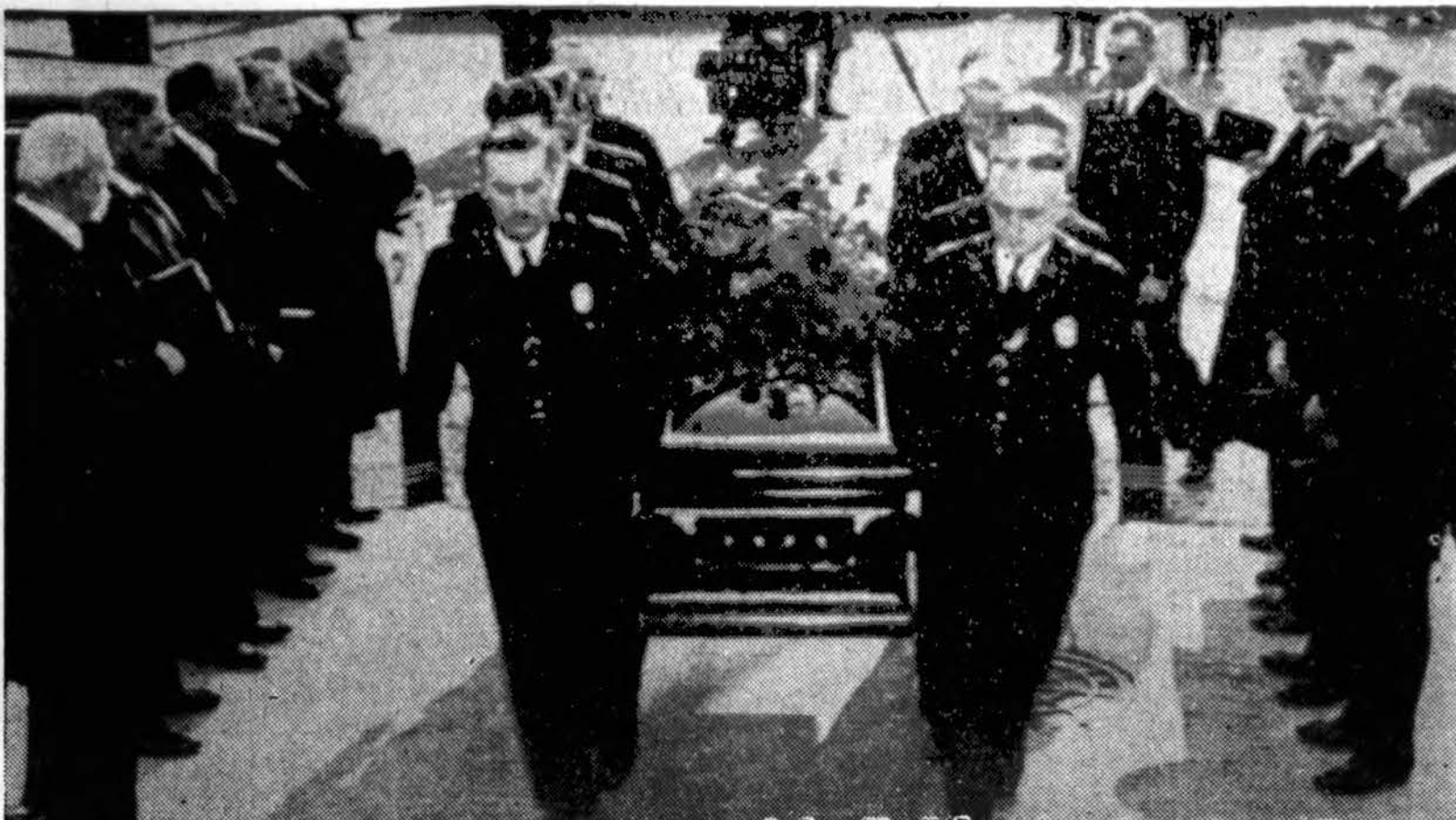
Amerikos Jungt. Valstybių Aukščiausiojo Teismo teisėjo Pierce Butler kūnas nešamas religinėms apeigoms į Šv. Mato katedrą, Washingtone. Abiejose pusėse Aukščiausiojo Teismo teisėjai. Kairėjį pūtnasis stovi Hughes, Aukšč. Teismo pirmi-ninkas.

sėmis, bet reikia savo valsty-bei atlikti ir pareigų, ypatin-gai tais momentais, kada val-stybei visų jos piliečių para-ma yra reikalinga".