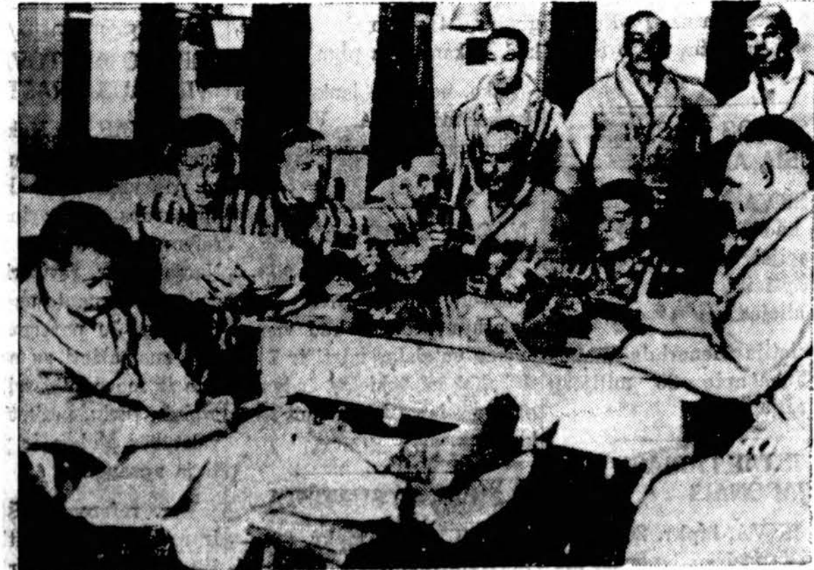
Į Harwich miesto (Anglijoj) liginę atgabenti pirmieji sužeistieji keleiviai nuskandin-to Olandijos laivo Simon Bolivar. Britų cenzūros leista ši nuotrauka iš Londono radio at-siūsta į Ameriką.