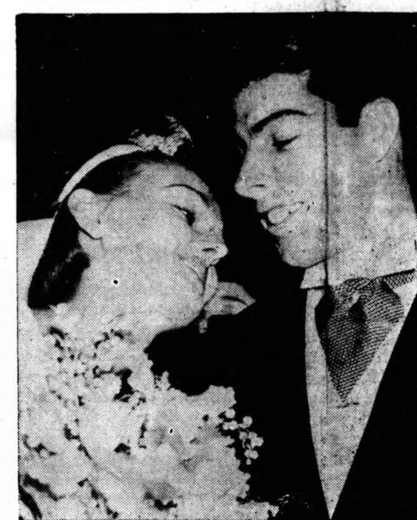
Joe Di Magio, vienas žymiausių basebolininkų, žaidžiančių su New York Yankees rinktine, susituokęs su Dorothy Arnold, San Francisco, Calif.

Vokietija išsigina minų sulėidimo. Kai kas spėja, kad, rasi, bus pačių britų iš kitur atplukdytos minos.