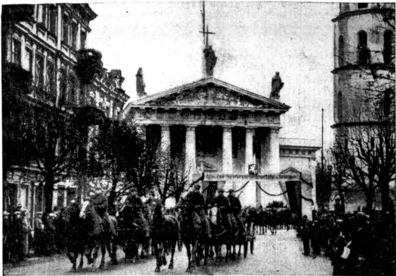
Mūsų artilerija Vilniuje. Artilerijos dalys pravažiuoja pro Vilniaus Katedrą.

KOPENHAGENAS, lapkr. 26. — Gauta žinių, kad didelis gaisras išliko vieną sovietų karo laivyno bazę Estijos pakrantėse. Vos išvaduotas sovietų municijos sandėlis.