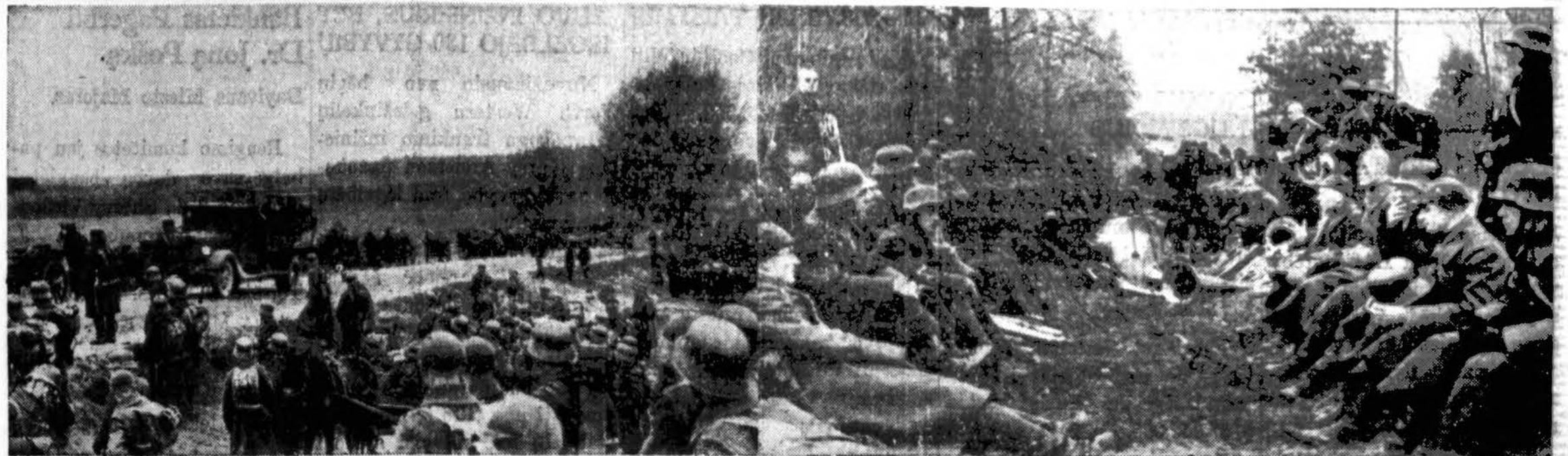
Lietuvos kariuomenės žygis į Vilnių. Vilniaus rinktinės daliniai pakeliui į Vilnių.

4. Nepilnamečiai negali dirbti išdirbimo, kasymo ir panašiose pramonėse. Negali taip pat dirbti ten, kur reikia operuoti, ar prižiūrėti kuliamos mašinos, kiti panašūs aparatai arba prie jėgos, varančios kitas mašinas, išėmus ofisų mašinas. Jie negali valdyti motorinių sunkvežimių ir dirbti ant jų kaip pagelbininkai. Taip gi negali būt sandomi pasiuntiniai viešose tarnybose (Messenger service). Prie laikraščių standų jie tegali dirbti prieš ar popiet, bet tik tarpe 7 val. ryto ir 7 val. vakaro.