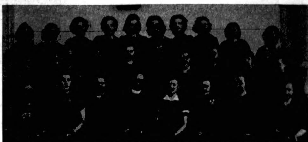
Šv. Kazimiero Akaremiijos Rėmėjų Draugijos Chicago Heights, Ill., skyrius.

1725 WEST 47TH STREET Kamp. Hermitage. Tel. Yards 2771 18 metų patyrimo.