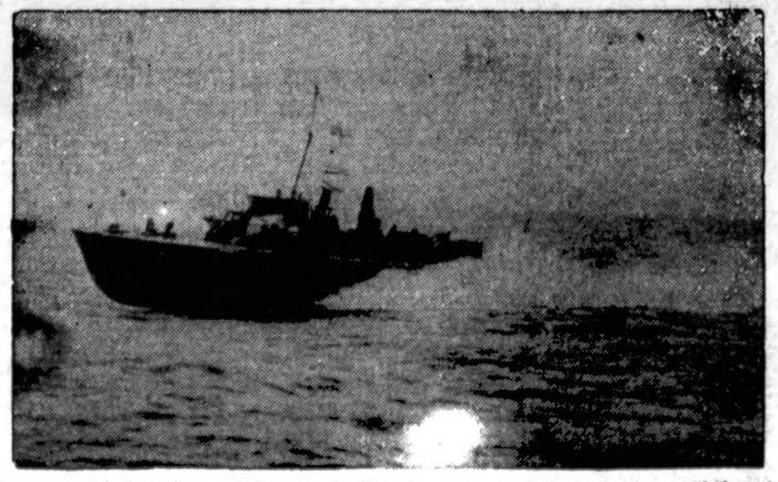
Britų prekybinis laivas "Rawalpindi", kurs buvo pakeistas karo laivu ir šiomis dienomis nacių nuskandintas. Su laivu žuvo apie 300 vyrų įgulos.

CHICAGO SPRITIS. — Šiandien debesuotumas ir kiek šilčiau. Saulė teka 6:55, leidžiasi 4:20.