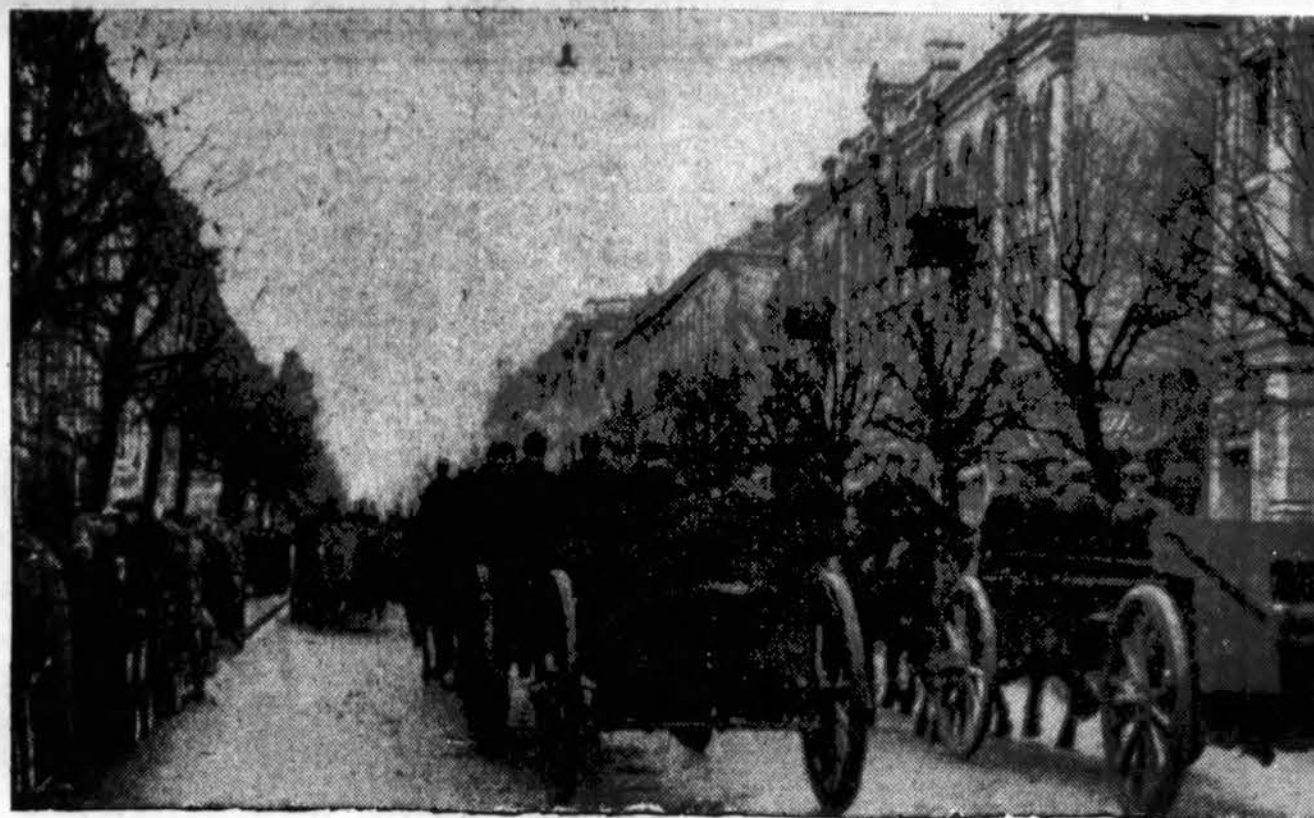
Lietuvos kariuomenės žygis į Vilnių.

— Daug gero padarė "Draugas" visose srityse. Jis remia lietuvius, kurie siekia aukštesnių vietų. "Draugas" gražiai pagelbėjo man atsiekti teisėjo vietos, jis pagelbsti kiekvienam geram lietuviui. Ačiū "Draugui", grįžau prie lietuvių... Valio tolimesniams "Draugo" darbu.