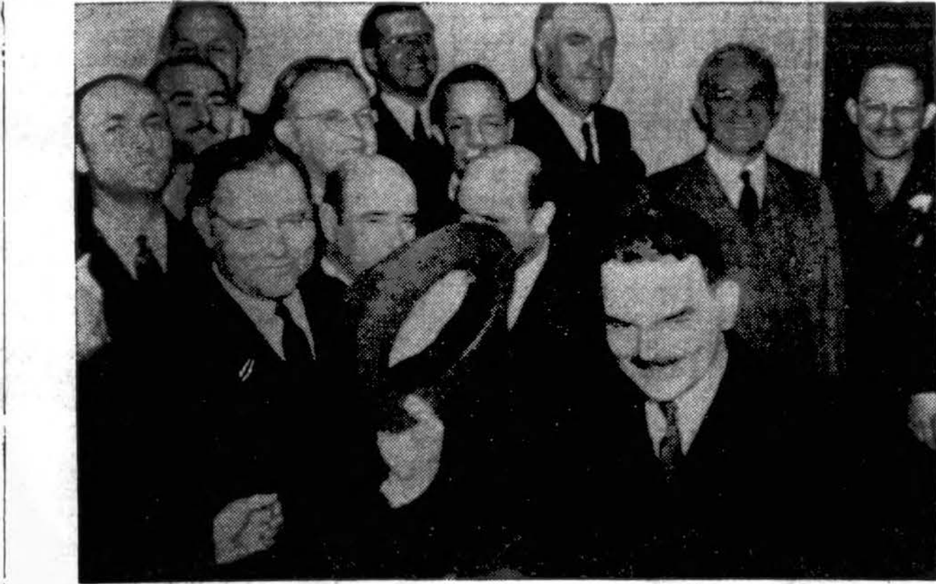
Šiomis dienomis New Yorke, Thomas E. Dewey (dešinėje, paskelbė kandidatuoja į U. S. prezidentus respublikonų sąrašė

Paduoda žinių apie sovietų lakūnų žiaurumus, kaip jie kulkašvaidžiais iš lėktuvų žu-