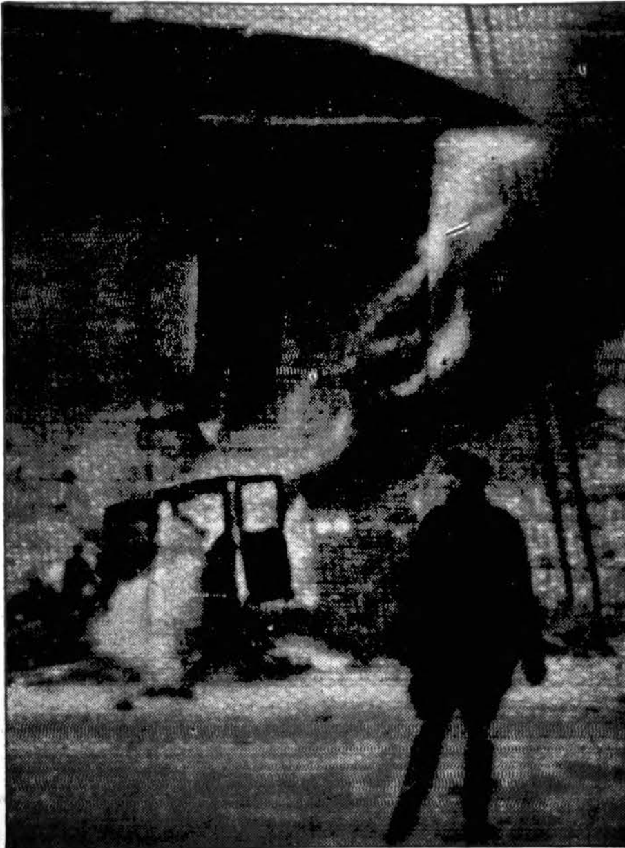
Liūdnas Helsinky, Suomijos sostinė, vaizdas po raudonųjų lakūnų puolimo.