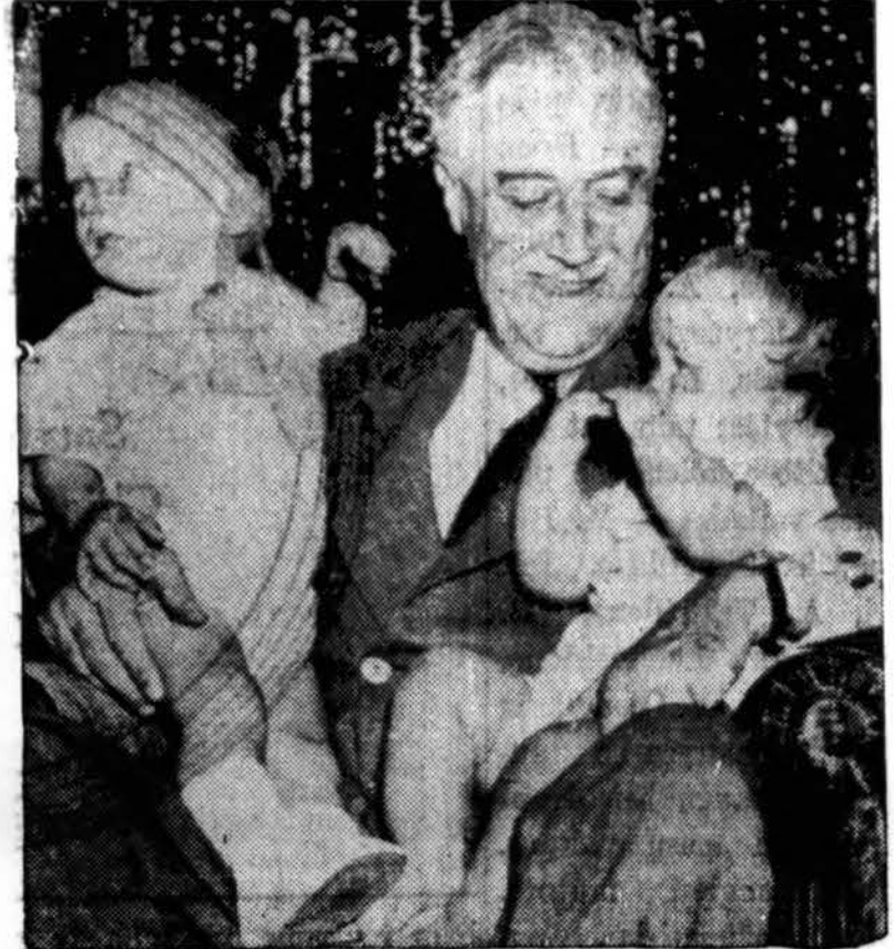
Šiemet visa prezidento Roosevelt giminė buvo suvažiavus į Washington bendrai švėsti Kalėdas. Šioj nuotraukoj matore prezidentą tarp dviejų proanukų.