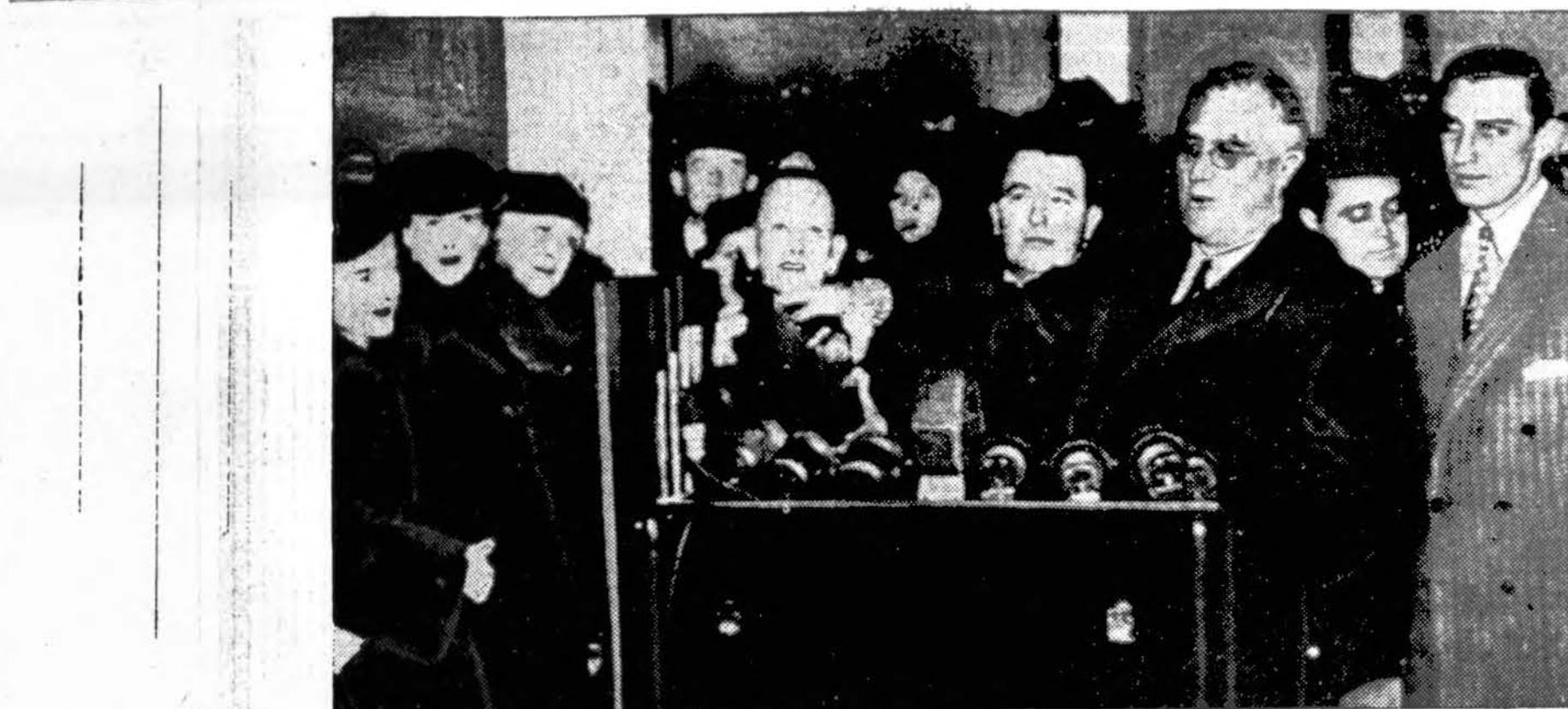
Bendruomenės kalėdinė eglaitė Washingtono. Vaizduojamas prezidentas Rooseveltas su savo šeimyna. Prezidentui paspaudus mygtuką, eglaitėje sublizgo įvairiaspalviai elektros žiburėliai.

HELSINKIS, gr. 26. — Iškelta aikštėn, kad karo pradžioje suomiai lakūnai smarkiai subombardavo sovietų karo laivyno bazę Kronštadą, netoli Leningrado — Suomijos įlankoje.