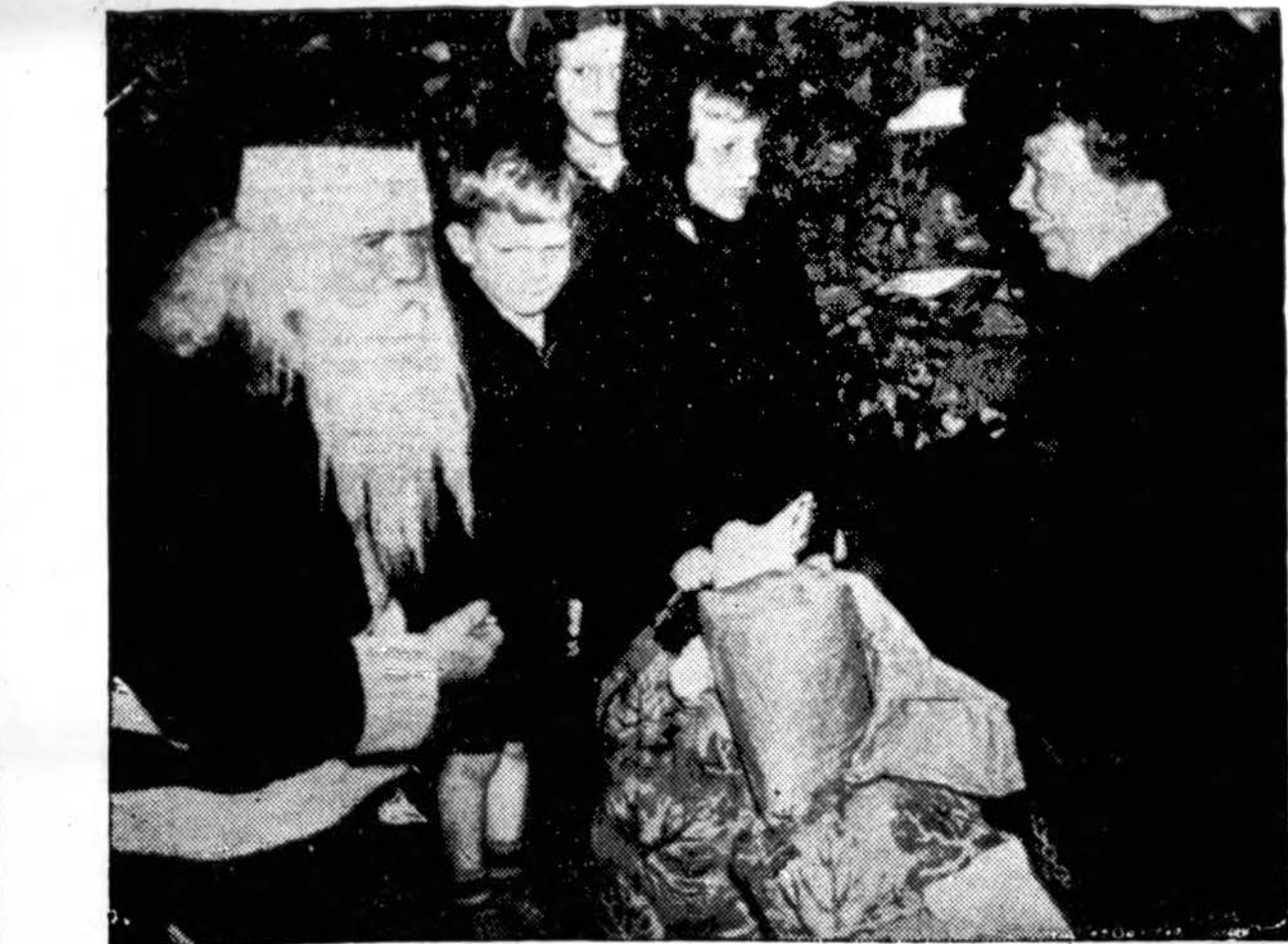
Amerikos Jungt. Valstybių prezidentas Santa Clause rolėje vienoj labdaros draugijoje, Washingtone.