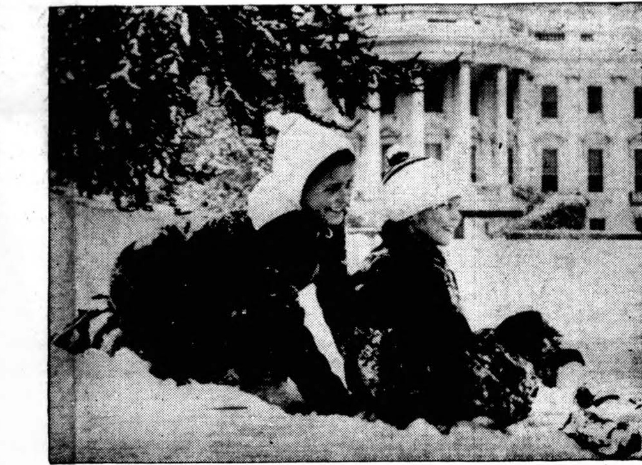
Ziemos džiaugsmas prie Baltųjų Rūmų.

PARYZIUS, gr. 28. — Prancūzijos vyriausybė pataria gyventojams šiandien ne galvoti apie taiką, bet rūpintis karo vykdymu ir laimėjimu. Kiek žinoma, vyriausybė nenori nė klausyti apie prez. Rooseveltto keliamą taikos klausimą.