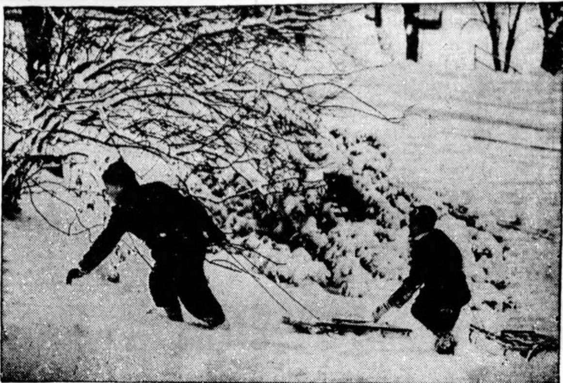
Ziema baltu apklotu pridengė pusę Amerikos, Cincinnati, Ohio, kur iškrito 10 colių sniego.

DUSETOS. — Smilgėse sudėgė moderniausia linaminė pylinkėje Rudzinsko linaminė. Daug kas pavyko išgelbėti. Užsidegimas, spėjama popirosas.