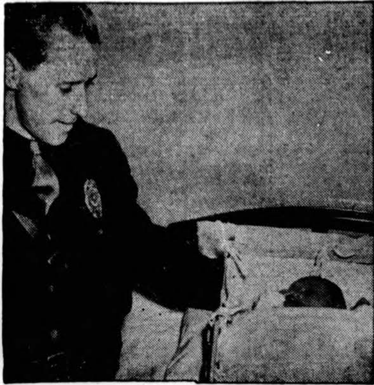
Indianos valstybės policininkas ir garsus bėgikas, Don Lash, sulaukęs sūnaus sutiko dalyvauti Sugar Bowl lenktynėse.

Nimeleris vėl į povandeninį laivą? Daugelis vokiečių eva-