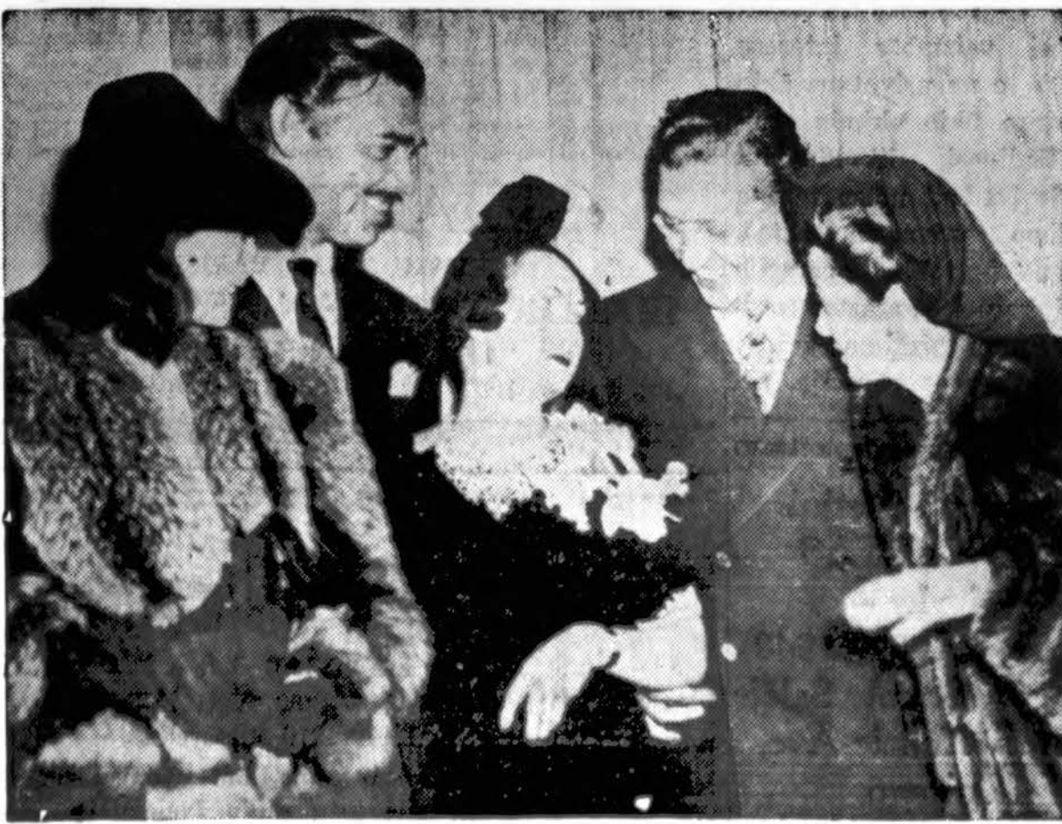
"GONE WITH THE WIND" ATLANTOJ.

"We have said: Strength and Courage. To see you is to be convinced and you do not lack either the one or the other. And We well know that both of them are so necessary to all Scouts. But strength and courage alone are not sufficient for the Catholic Scout." .... "St. Paul says where matter is predominant, violence, intemperance and uncleanliness hold sway. But on the other hand, where the spirit predominates are to be found all the sweetnesses of charity with all the graces of purity. It would appear that the words had been especially written for you, for in them you will find that which should be the splendour and glory of your life."