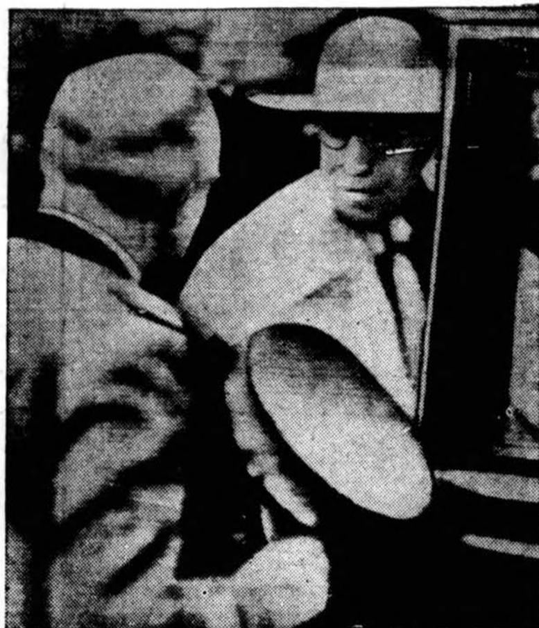
Nuvykęs į Kivinalą su revizita Šventąjį Tėvą Pijų XII, kaip čia vaizduojama, pirmasis pasitiko ir sveikino Italijos karalius Viktoras Emanuelis.

HELSINKIS, gr. 29. — Karelijos tarpjūry, Leningrado šone, sovietai prieš suomius sutraukė 100,000 kariuomenės tikslu įlaužti Mannerheimo tvirtovių liniją, kuri iki šiolai neįlaužiama ir kur jau dešimtys tūkstančių raudonųjų paguldė galvas sausumoje ir ežeruose. Raudonieji vadovauti iš Sibiro pakviestas naujas sovietų armijos gen. G. M. Šternas, kurs Tolimuose Rytuose buvo užėmęs pašalinto ir nežinia kur dingusio maršalo Blincherio vietą. Nežinia, kaip jis išves puolimą prieš suomius. Suomiaii viliasi nugalėti gausingiausią sovietų armiją. Raudonųjų pagalba sutraukta daug lėktuvų. Patirta, raudonieji masiniai pulsai paimti Viborgo miestą, kurs žymiai apgriautas sovietų stambiųjų patrankų šoviniiais. Per eitą naktį suomiaii lakūnai tas raudonųjų patrankas aptiko Karelijos tarpjūry ir joms veikimą nutraukė. Tačiau šiandien jos ir vėl subaubė. Toliau šiaurinių link rytiniam karo fronte suomiaii keliose vietose išardė sovietų šiaurinių geležinkelį.