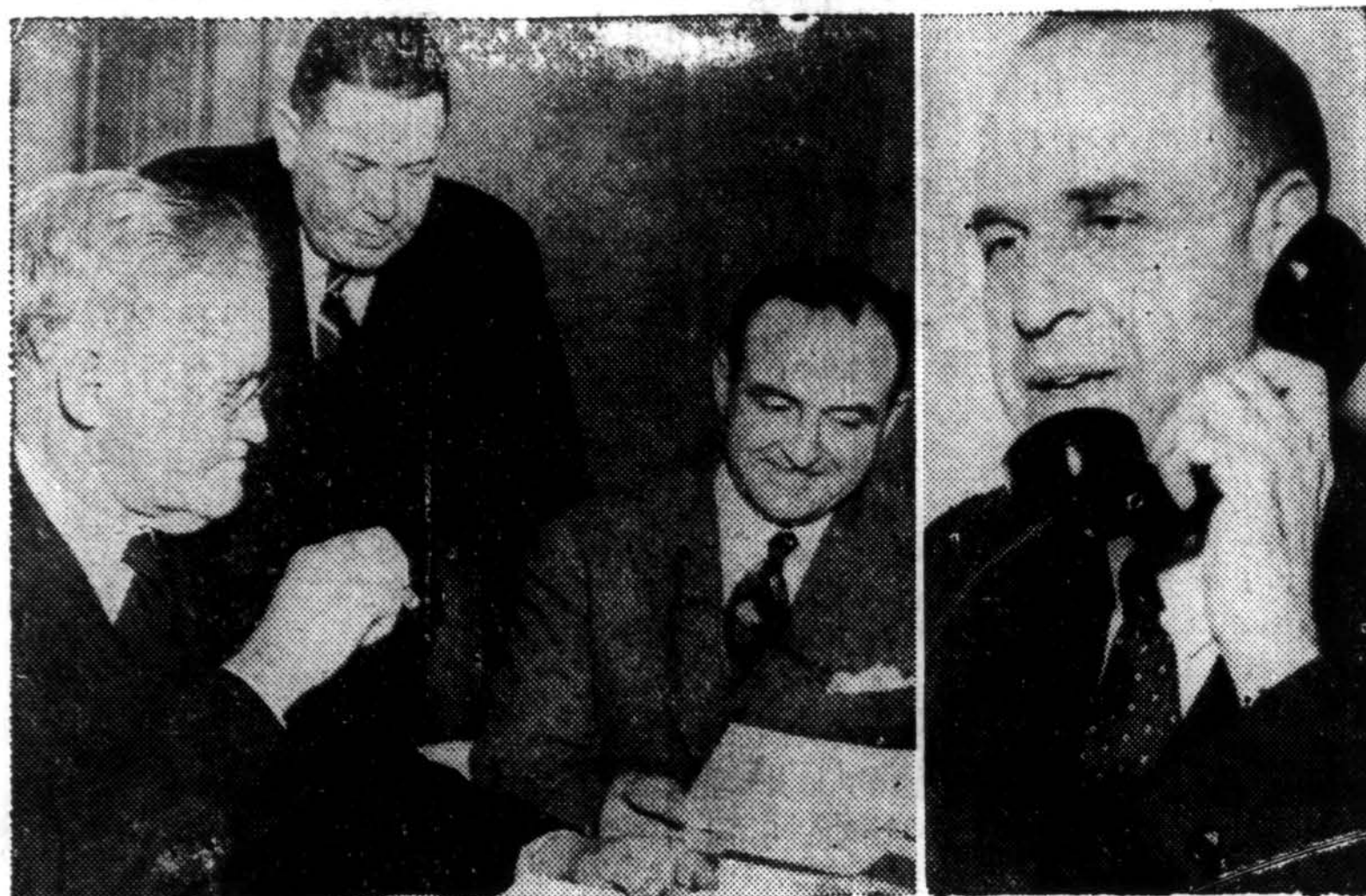
Chicago atvyko federaliniai senatoriai Clyde Reed iš Kansas (kairėje) ir Lister Hill iš Alabama (dešinėje) tirti vykdomas suktybes per piliečių balsavimus. Jiedu turi pasitarimus su Chicago Better Government Assn. viršininkais.

priešinti ir norėta. Tačiau priešintis neturint "natūralių fortifikacijų, mobilizacijos ir panašiai" nepravartu ir neįmanoma.