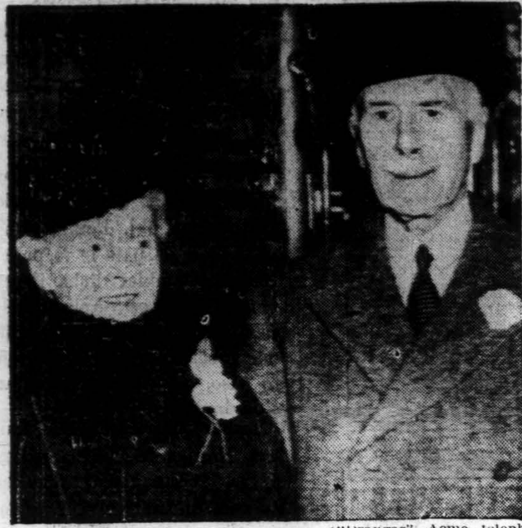
Kanados generalinis gubernatorius, Athlone prinčas, dabartinio Anglijos karaliaus Jurgio XI dėdė, su žmona aplanko prezidentą Rooseveltą Hyde Parke, N. Y.

atsiakę remti lietuvių Pietų Amerikoje gyvenančių. Aš neprašau, kad paaugotų kelis dešimtis tūkstančių, bet kad nors kiekvienos kolonijos bažnyčioje būtų padaryta atskira rinkliava Los Angeles lietuvių paramai. Jei tikrai iš kiekvienos kolonijos būtų 10 dolerių, tai per šimtą kolonijų pasidarys 1,000 dolerių, o man tikrai tiek reikia įmokėjimui už namą, kuriame įtaisysime bažnyčią. Gi paskui per aštuonius metus išmokėsim 500 dolerių ir turės Los Angeles, Cal., lietuvių nuosavą bažnyčią. Valžinėti per kolonijas su pralkbomis ir rinkti pinigų neužsimoka, nes kelionė iš Los Angeles, Cal., duokime į Bostoną ar kitur apie Atlantą yra nemažesnė kaip nuvažiuoti į Pietų Ameriką ir lankymas visų kolonijų apseity daugiau negu tūkstantis dolerių. Todėl aš nemanau važiuoti per kolonijas rinkdamas pinigų ne tik iš tos priežasties, kad daug išlaidų bus kelionei, bet ir antra priežastis, kad turėčiau bent trims mėnesiams apleisti žmo-