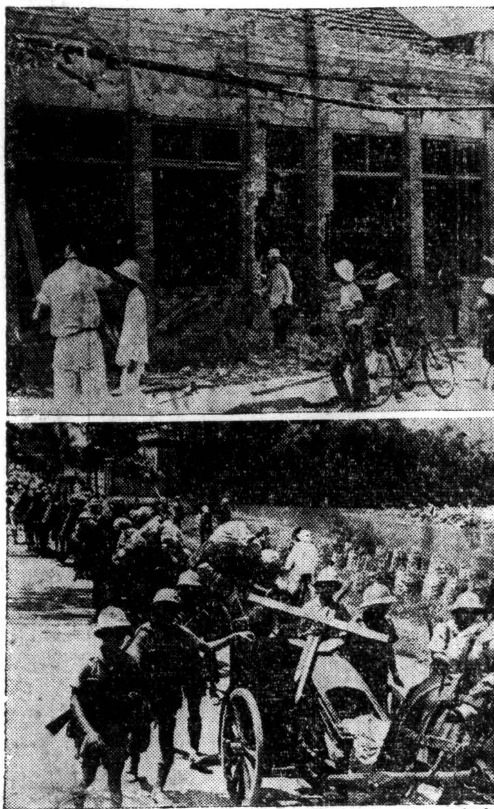
Japonų kariuomenė įsiveržia į prancūzų Indokiniją. Viršutiniame vaizde matomi Haiponge japonų “per klaidą” subombarduoti namai. Apatiniame — anamitų kariuomenės pasitraukia, kad nesipriešintų japonams.