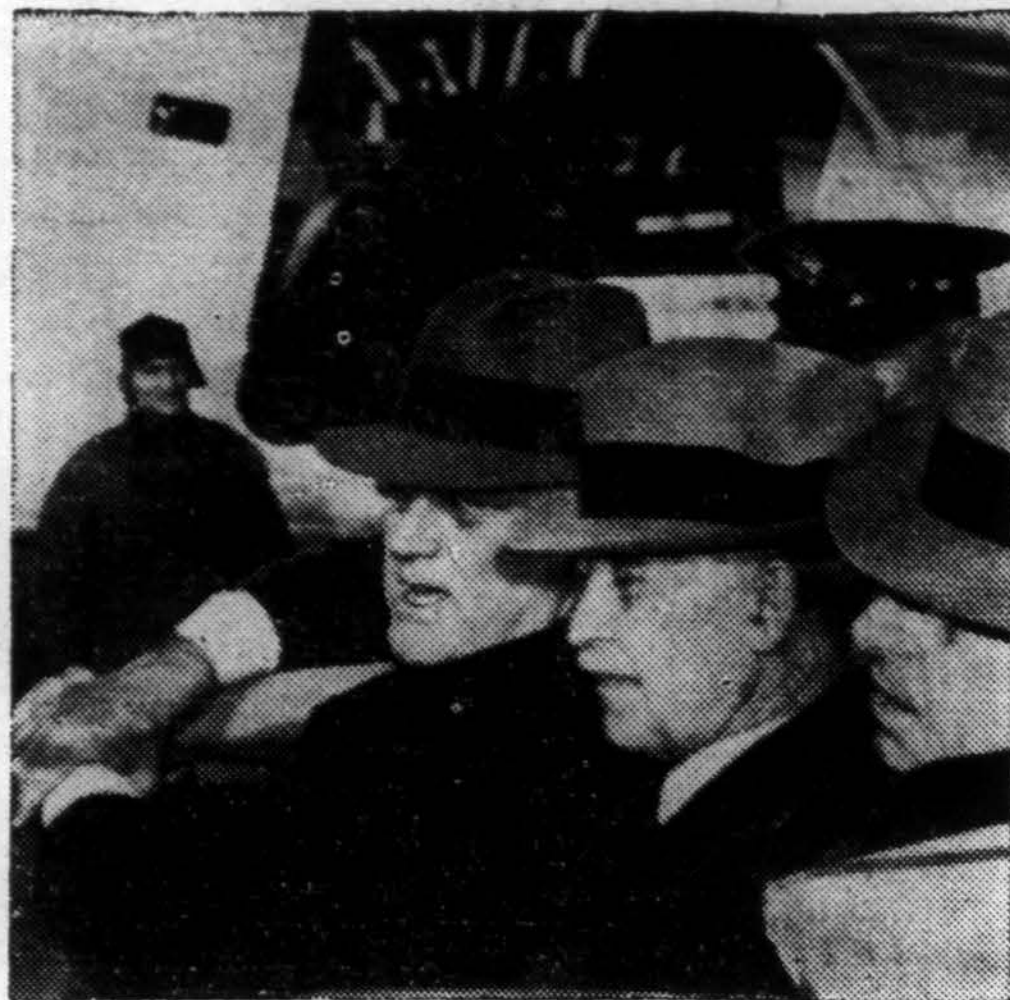
Prez. Rooseveltas, Orville Wright ir buvęs Ohio gubernatorius J. Cox (iš kairės pusės į dešinę) apsilankė karinėse aviacijos mankštose Wright Fielde, Dayton, Ohio.