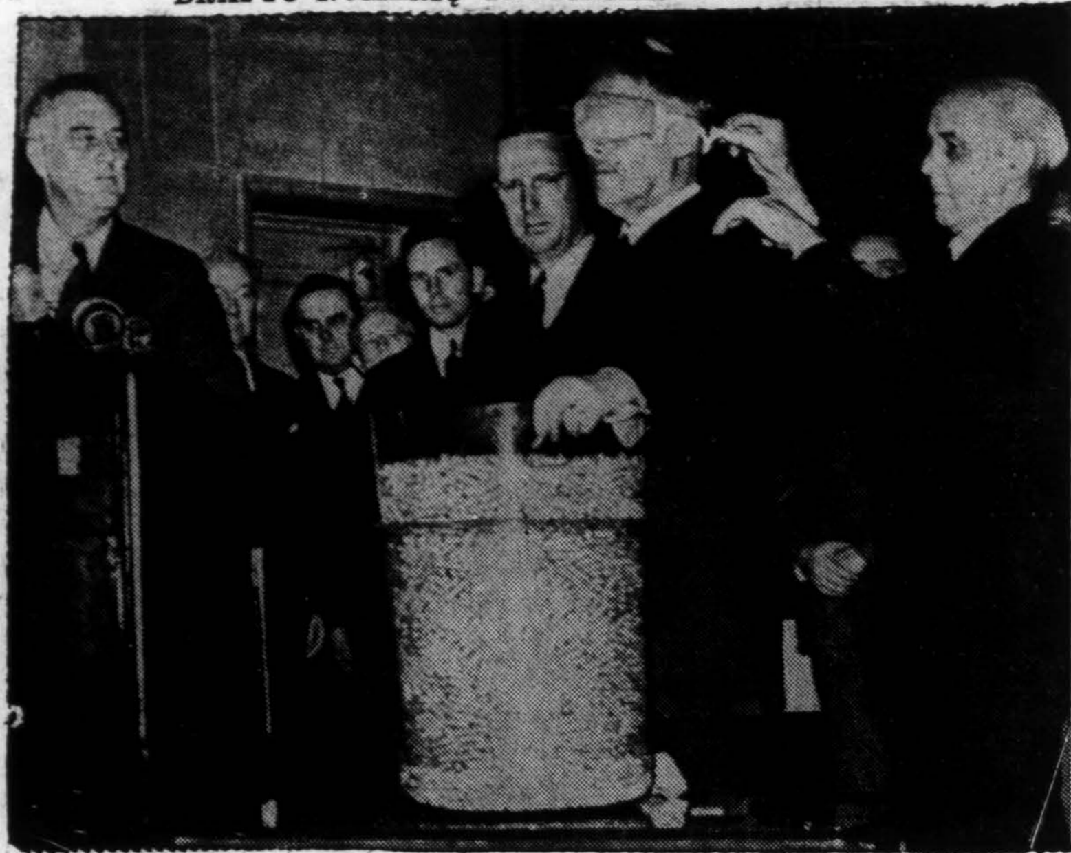
Karo sekretorius H. L. Stimson ištraukia pirmąjį drafto num. 158 Washingtono. Dešinėje yra prezidentas Rooseveltas.