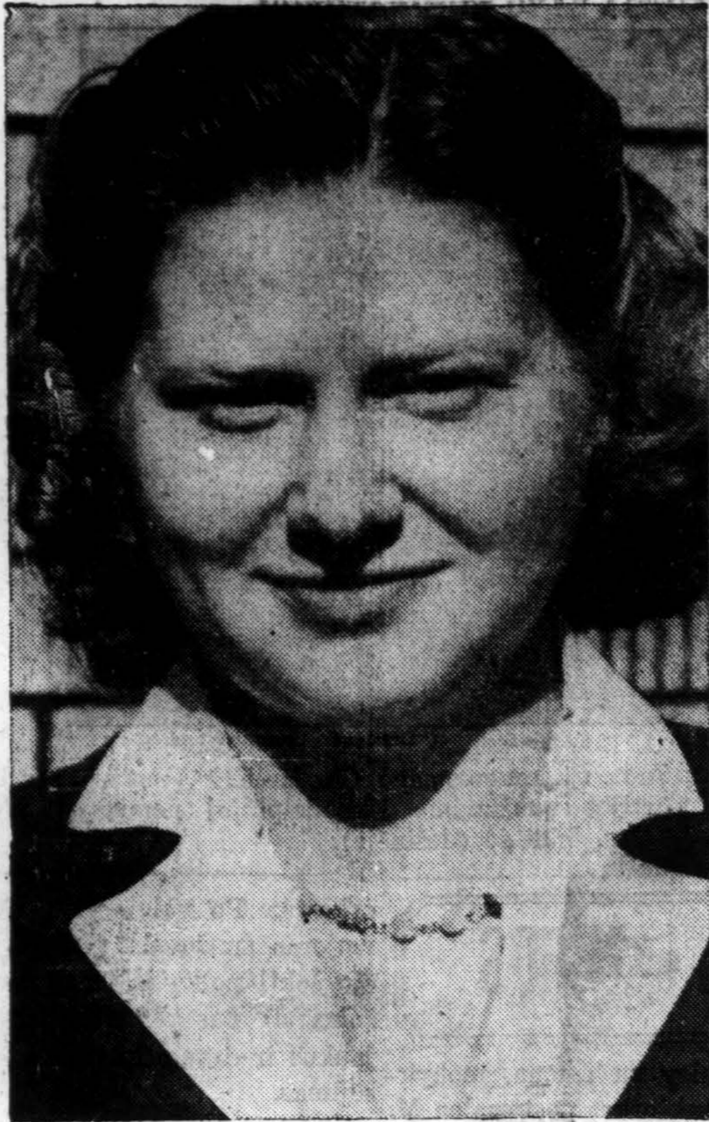
"Draugas" Acme telephoto

Visi laukiam kas toliau bus, nes dabar darbas eina sparčiai, žinoma, griovimo, nes pastatytą sugriauti greičiau eina, kaip statyti. Spauda plačiai rašo, kad dabar esam laisvi nuo Smetonos režimo. Tas tiesa, Smetonos režimas žlugo, bet ūkininkai jau pradeda žūrėti ir naują vyriausybę dar su didesne baime, kaip į smetoninį režimą, nes jau griau-nant matyti, o statant dar ne ir, gal būt, kad ūkininkai visai išnyks, o, gal, priešis prieš kolhozų ir tuomi būsim tikrai visi lygūs ubagai. Tuon ir haigiu rašyti". Ot, ir "laisvė" Lietuvoje! Ubagynė, išskyrus valdžioje esančius, komisarus. K. D.