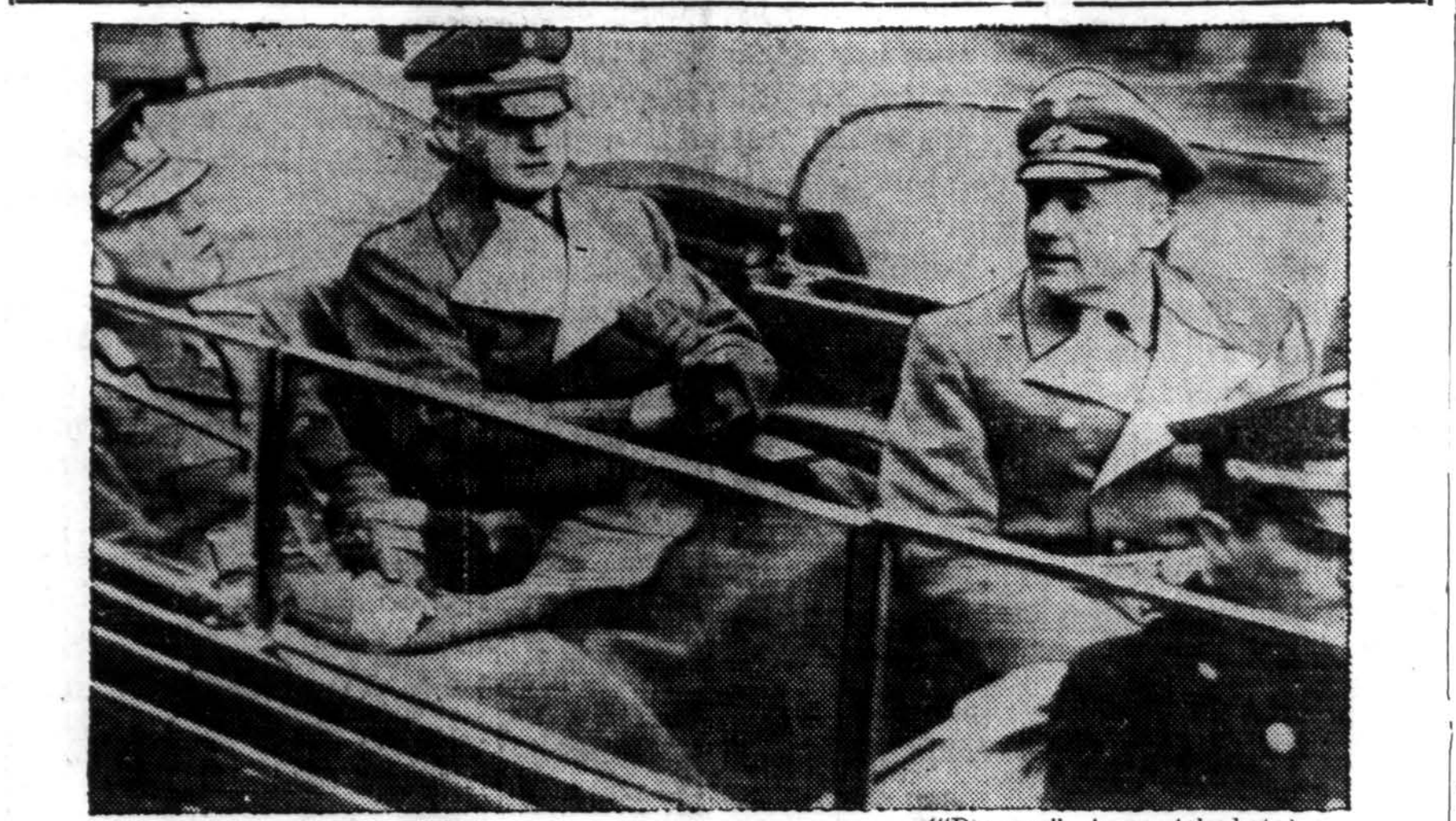
Gen. Ion Antonescu (kairėje), rumunų diktatorius, Vokietijos užs. reikalų ministro Ribbentropo lydimas, vyksta į kanclerio rūmus, Berlyne, tartis su Hitleriu. Dešinėje yra perkalbėtojas.

talikiškoji visuomenė, suprastama senelių prieglaudos reikalą, suprato, jog tos prieglaudos pastatymui reikalingo ir pinigų. Žymiausių pinigų sumą įteikė West Side kuopa — $1,100.