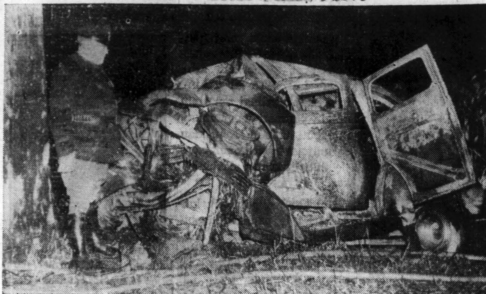
Zion, Ill., vidurinės mokyklos keturi mokiniai Kalėdų rytą automobiliu vyko į Kenosha, Wis. Automobilis smogė į medį ir užsiliepsnojo. Visi keturi žuvo (Apie tai rašoma vietinėse žiniuose).

Vienas žymus inteligentas, profesionalas su skaitlingesne šeima praneša iš Lietuvos gerai gyvenas: turis dviejų kambarių butą. Laišką gavo iš praneša iki Sovietų atėjimo jis naudojo šeimos ir profesijos tikslams 8 kambarių butą.