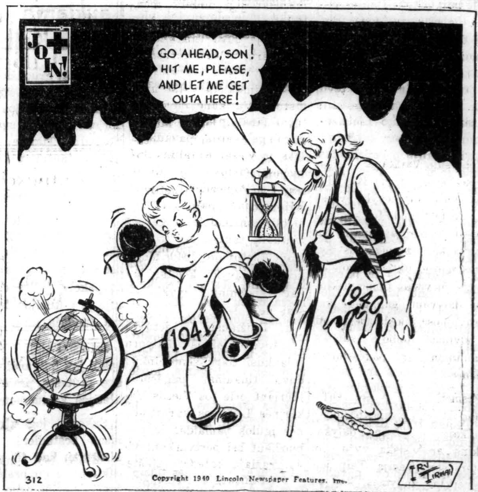
SENIEJI IR NAUJIEJI METAI