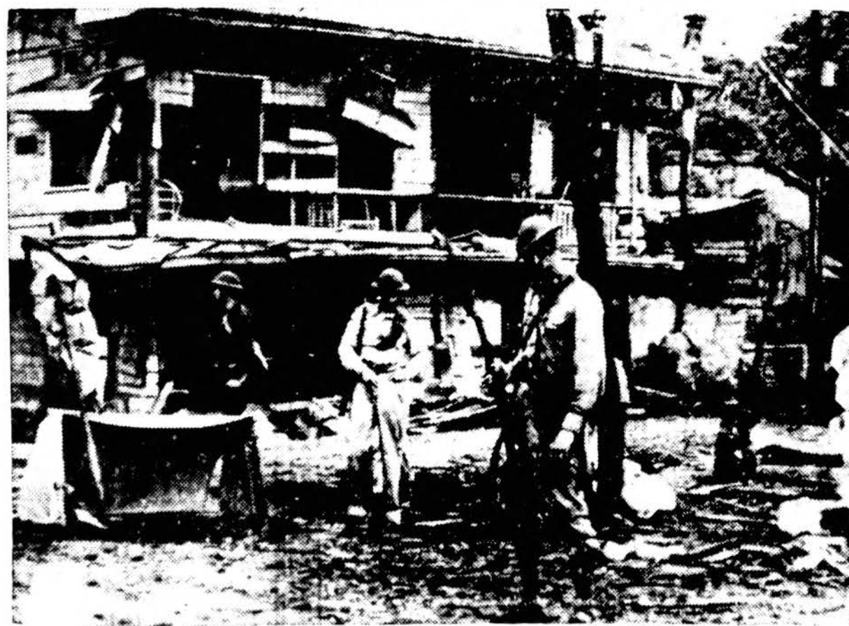
("Draugas" Apie telefoną)

Amerikos kariuomenė apžiūri japonų bombanėsių sugriautus namus Paranque mieste pirmosiose japonų atakose. Paranque yra prie Manilos įlankos tarp Cavite ir Manilos.