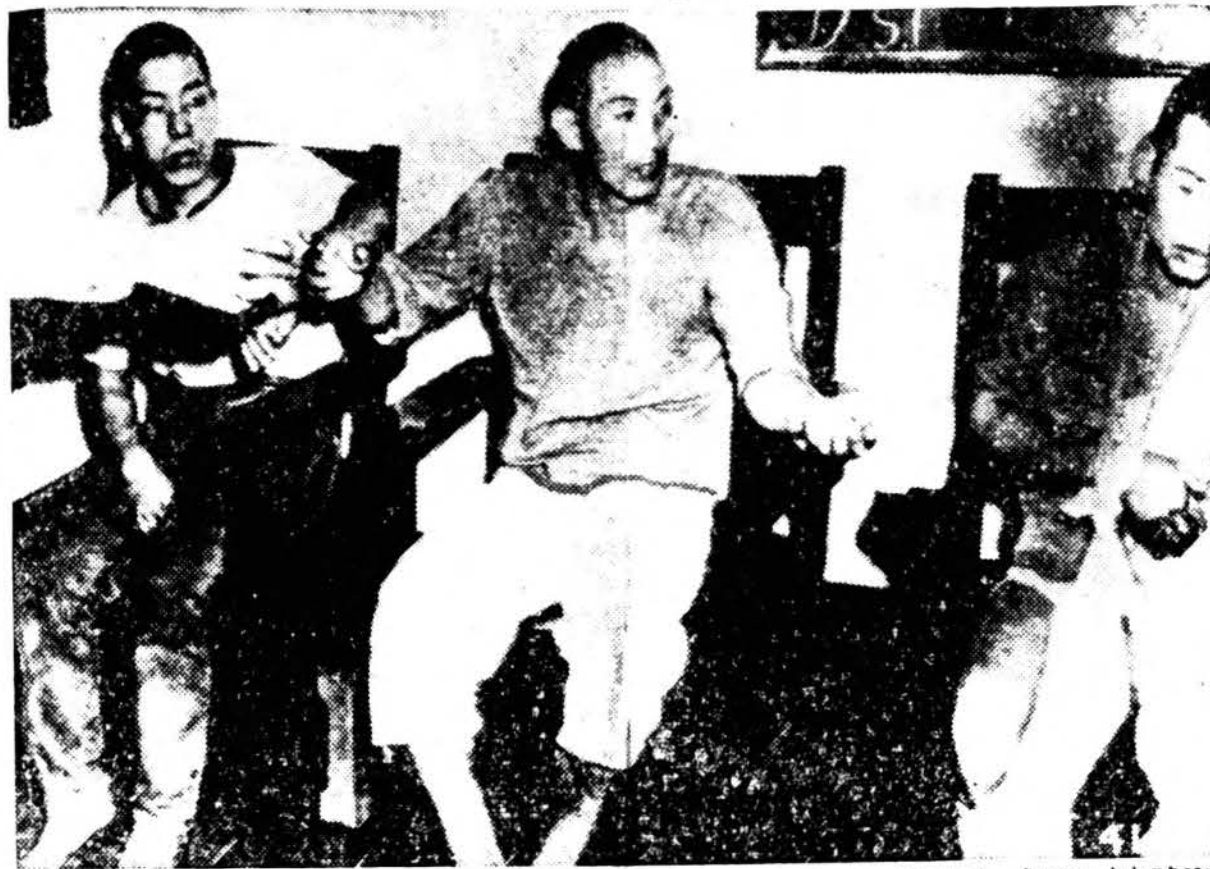
Suimtieji japonų aviatoriai pirmųjų atakų metu ant Filipinų sostinės Manilos.

LONDONAS. — Vokiečių karo laivų atakos prieš lydimus Amerikos ir Anglijos prekinis laivus į Murmanską su karo reikmenimis visiška nepasisekė. Vienas vokiečių naikintuvas ir trys submarinai sugadinta. Nukentėjo ir du britų karo laivai. Jie tačiau be pagalbos grįžo į uostą.