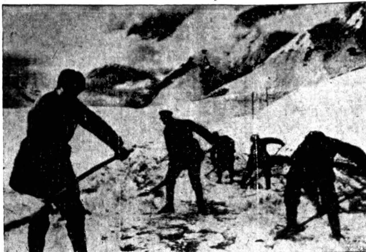
Rusų kareiviai, žemiškai apsirengę, valo kelią savo draugams žygiuoti į šiaurės Kaukazą. Vokiečiai daug nukentėjo nuo rusų kareivių ir generolo žiemos.

pildyti. Vienas iš tų darbų buvo nupirkti seneliams Kalėdų dovanų ir tai padarėta. Seneliai labai džiaugėsi dovanomis.