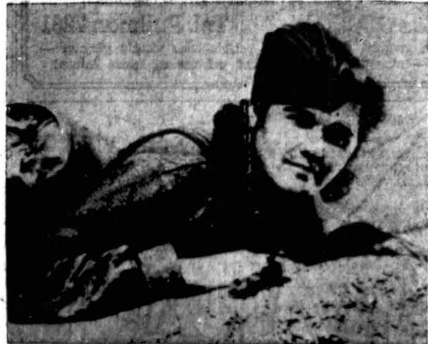
Leningrado apylinkėje, pasiliko pirmose fronto linijoje ir teikia pirmąją pagalbą kareiviams, kada ji du kartų buvo sužeista.