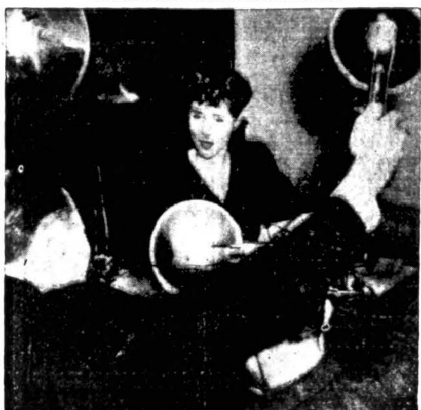
Clare Boothe Luce, kongreso atstovė Washington, naujai išrinkta į kongresą, fotografuojama spaudos konferencijoje.

kad ši diena yra Jėzaus Vardo diena ir pakvietė visus narius dalyvauti Sv. Valandoj popiet 3 valandą.