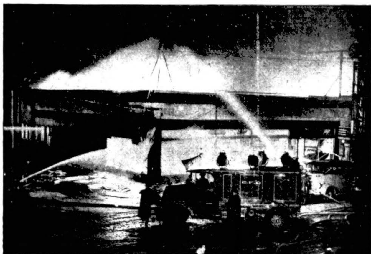
„Draugas“ Acme telefono.

Ugnegesiai kovoja su ugnimi Beverly Recreation Parlor, Chicago, kur šeši žmonės žuvo ir 33 buvo sužeisti, kada ugnis nušlavė vieno aukšto plytų namą. Gaisras kilo iš elektros vielos; žiežirba nukrito ant neseniai išteptų grindų ir įvyko eksplozija.