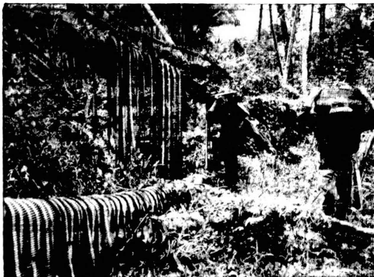
Amerikos kareiviai pristato amunicijos dėžes į frontą, Buna aylinkėje, Naujoje Gvinėjoje.