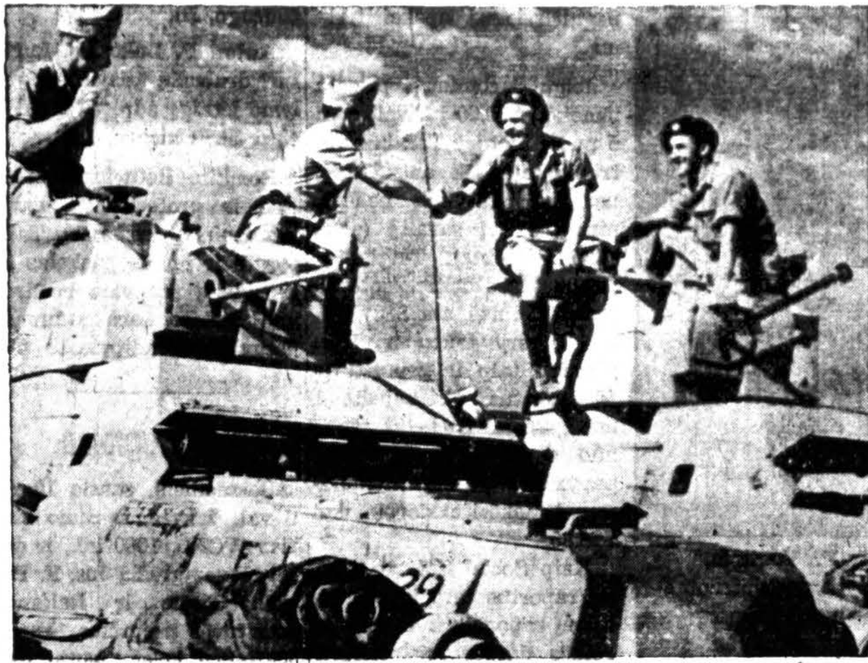
Kovojančių prancūzų Pirmoji Kolumna sveikinasi su britais, kurie Tunisijoje smėlynuose išvėkė visą vokiečių kolumną vartojant amerikiečių prieštankinius ginklus.

papurtė galvą ir pasakė: "Aš manau, kad man teks visą kelionę poilsį praleisti ant mataraso".