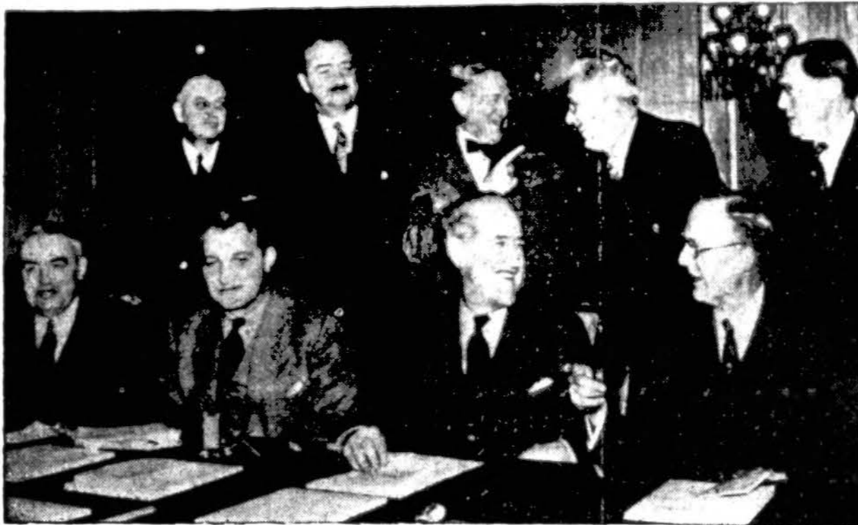
("Draugas" Acme telefono.)

Senatorius McNary, rep., (viduryje ir toliausiai atsistojęs) tariasi su naujais senato nariais ir duoda nurodymus apsiėjime senate.