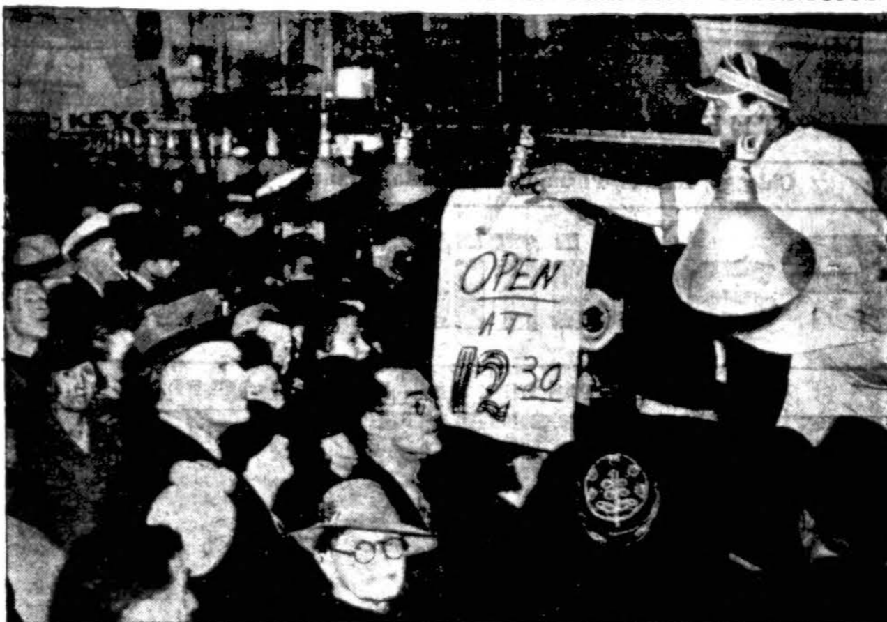
Vaižue matosi, kai ngos eties iaukia pirkti mėsos prie bucernių San Francisco miestė, nes patys buėeriai turi laukti kol jie gauna mėšą. Paprastai San Francisco gyventojai gaudavo 419,000 svarus mėšos, bet šiuo laiku gauna tik penktą dalį.

Linkime visiems kuo linksmausių 1943 metų! Šiais metais darbuokimės dar daugiau Amerikai ir nepamirškime vargšės Lietuvos. Mes galime daug jai padėti, jei tiktai norėsime. Kaip anglų kalboj sakoma "Where there's a will, there's a way". Kas nori, tas gali. Visi galime nors maldele remti tėvynės reikalus. Pas Dievą malda daugiau reiškia, negu kulkos.