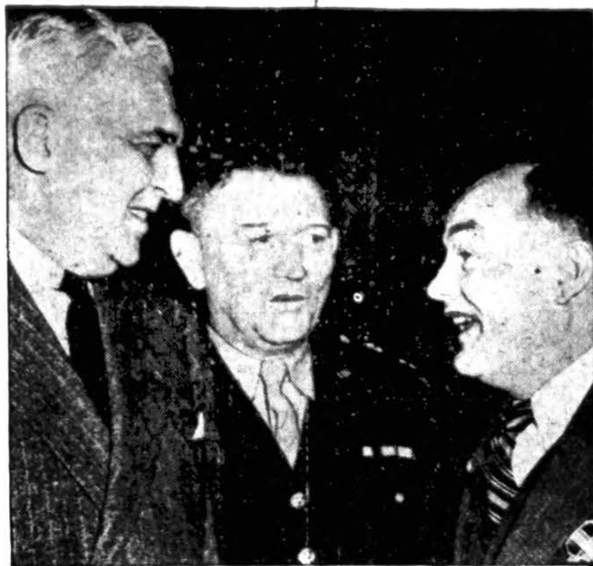
War Manpower Commissioner Paul V. McNutt, Selective Service Director gen. Lewis B. Hershey, ir Secretary of Agriculture Claude R. Wickard (iš kairės į dešinę) dalyvauja senato komisijoje, tariasi dėl farmų mašinerijos ir darbo jėgų stokos.