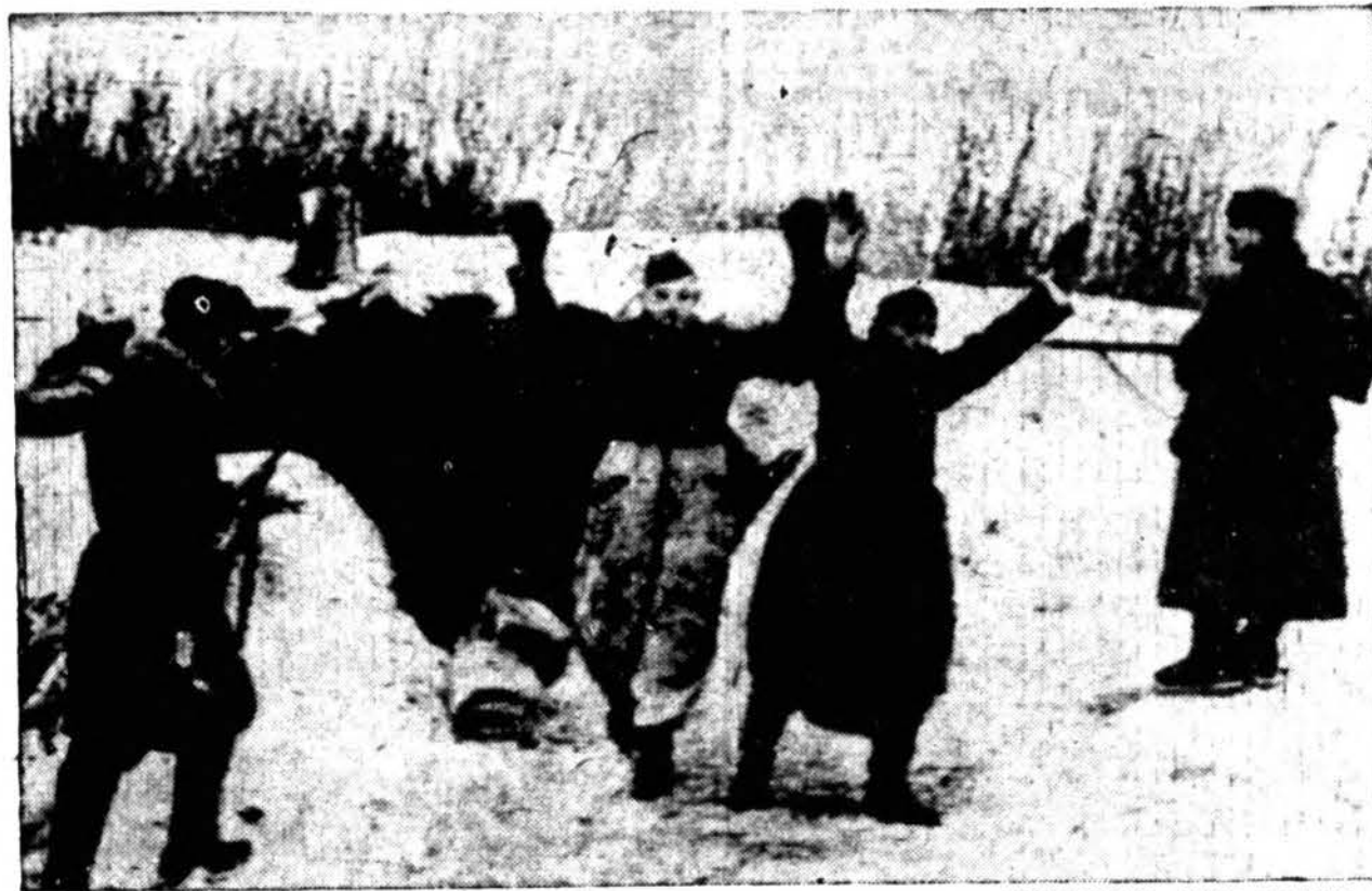
Rusai praneša, kad rusų armija užmušė ar paėmė 150,000 vokiečių Stalingrede, kuris yra apsuptas. Čia parodoma kaip vokiečiai paimami ir nelaisvė. Foto iš Maskvos atėjo į New Yorką.