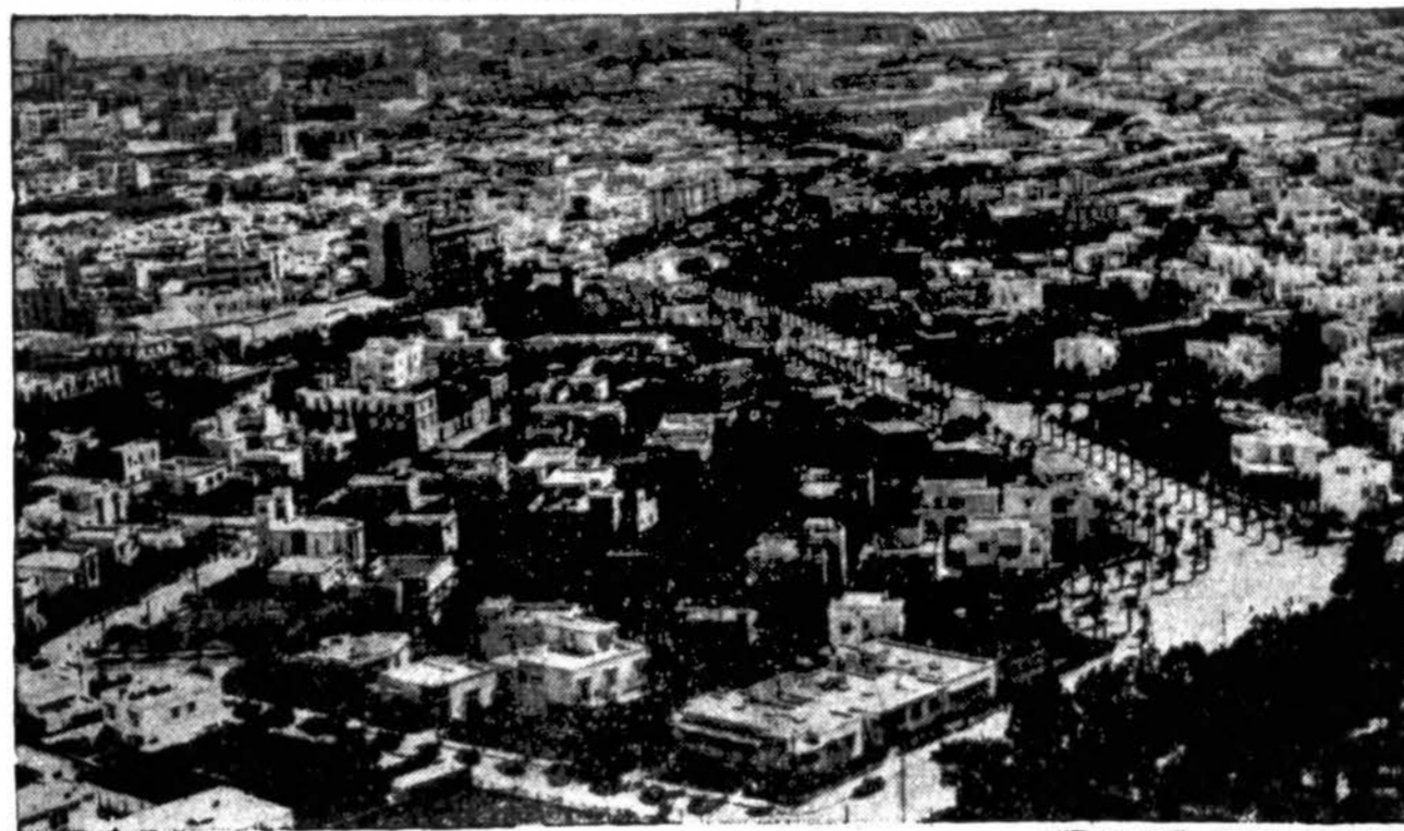
“Draugas” Acmo telephoto

KUR SUSITIKO PREZ. ROOSEVELT IR CHURCHILL