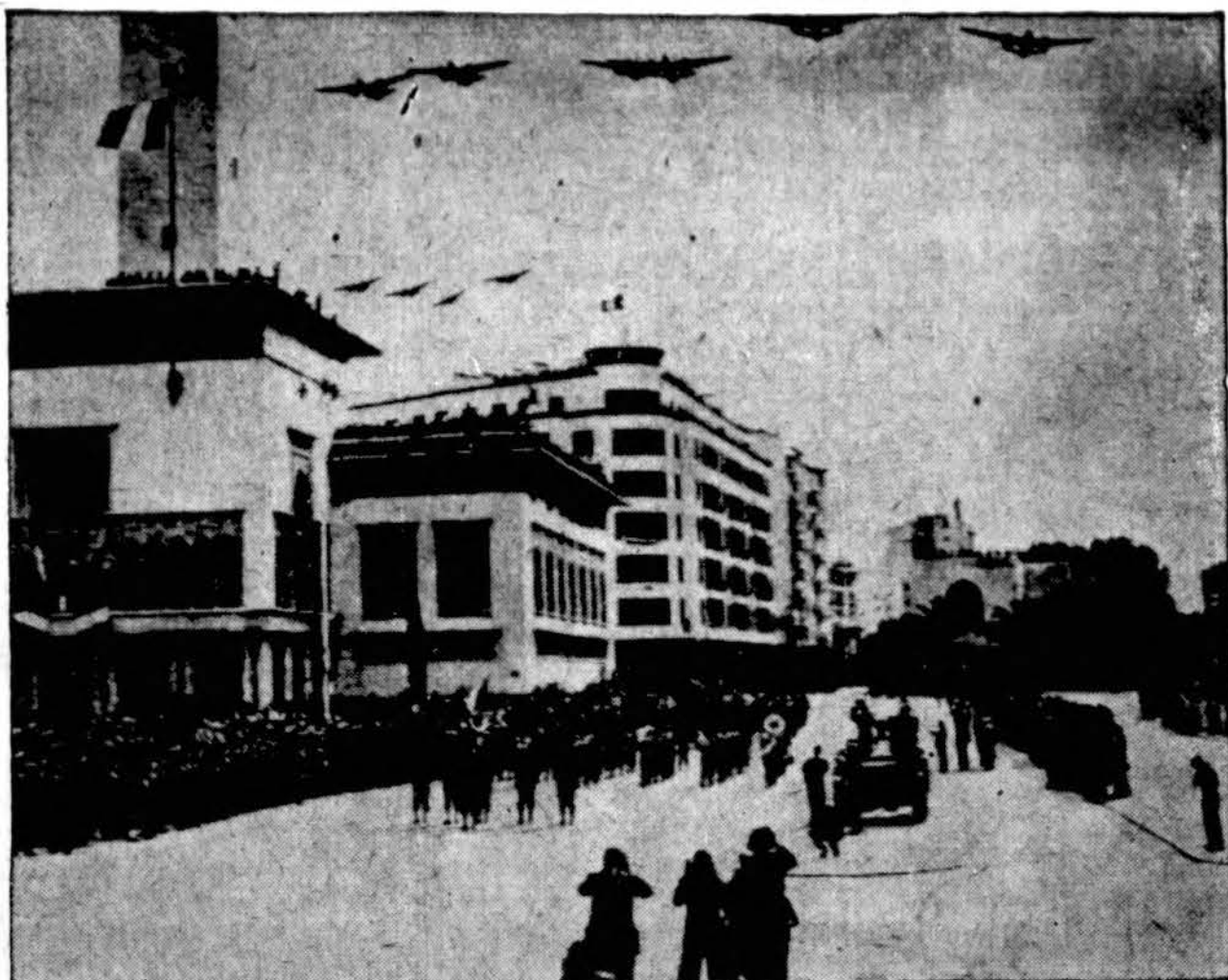
Laisvųjų prancūzų vėliava plevėsuoja, Amerikos lėktuvai skraido, Casablanca gyventojai kelia ovacijas kai prancūzai ir amerikiečiai kareiviai žygiuoja miesto gatvėmis šiaurės Afrikoje. Ši scena vaizduoja prez. Roosevelt ir ministerio pirm. Churchill istorišką posėdį, š. Afrikoje.

sakę. Kaip išklauso apie visą labdaryų veikimą, kiekvienas pasako, kad yra labai reikalinga padėti ir tuoju pakloja šimtinę.