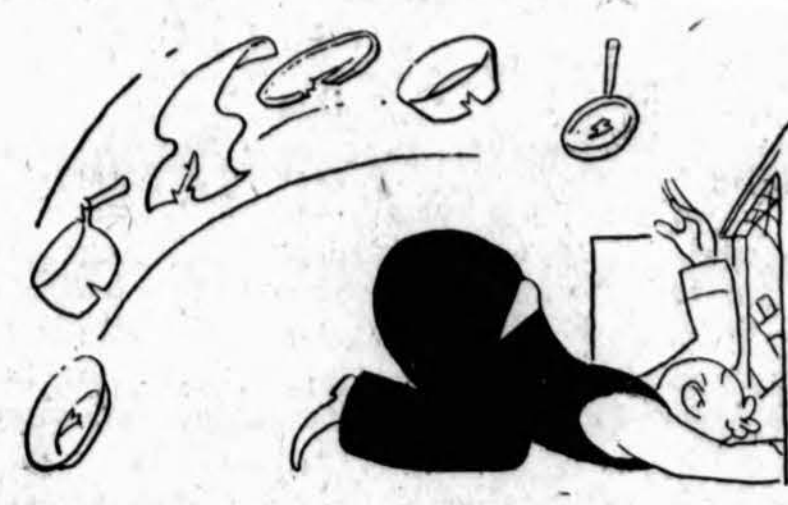
A V-Home salvages materials needed for war production. Search closets, attics, and basements for scrap, suggests OCD, and keep these spaces cleared of trash to protect against fire, both from fire bombs and from carelessness. The illustration was contributed by Gluyas Williams. Make your home a V-Home!

Nepamirškime visi, kad dieni. "Draugo" metinis koncertas įvyks vasario 21 d., Sokol salėje, 2345 So. Kedzie Ave. Bus atvaiddinta veikalas-operetė "Lietuvaitė". Rap.