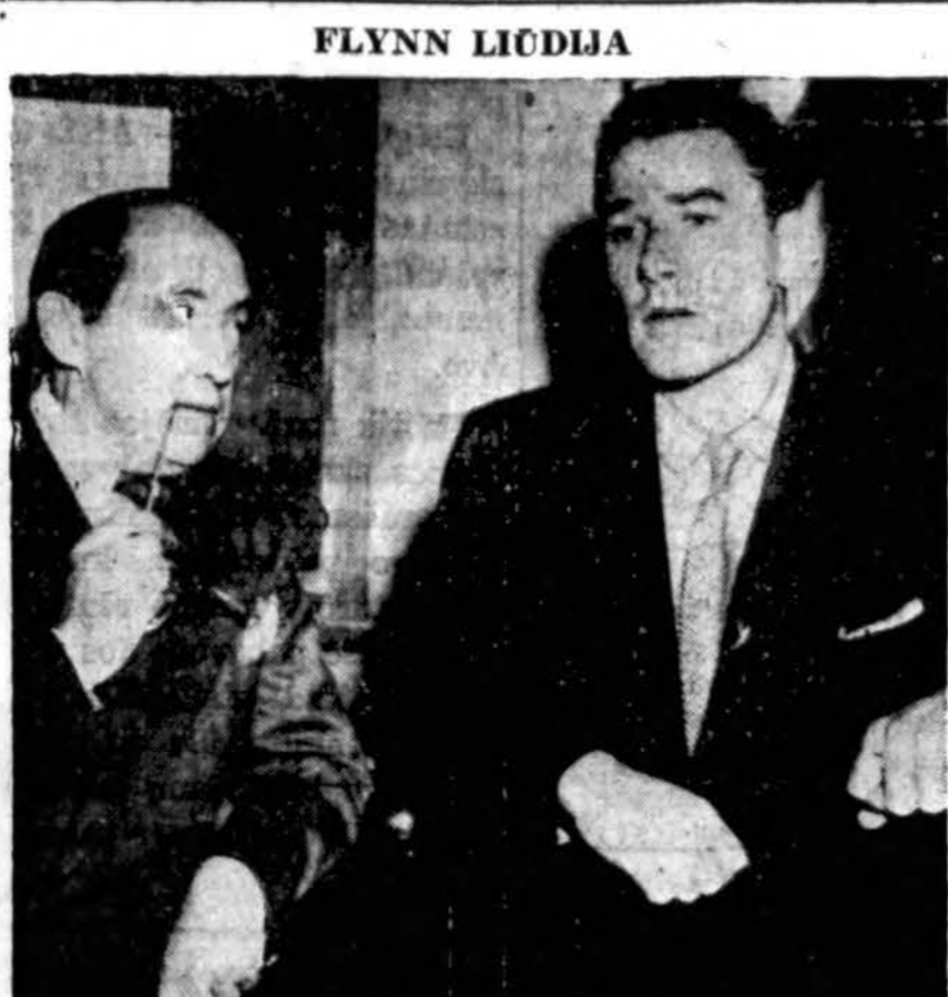
Filmų žvaigždė Errol Flynn, su savo advokatu, Jerry Geisler, atsisėdo į liūdytojo kėdę, Los Angeles teisme, kad atsakyti į dviejų nepilnamečių mergaičių apkaltinimą.