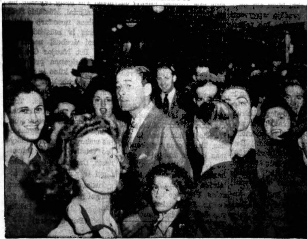
Pilietis teismo salė ir koridoriai žmonių, kurie nori pamatyti filmų žvaigždę Errol Flynn teisme, kuris kalinamas dėl dviejų nepilnamečių mergaičių nusikandimo.