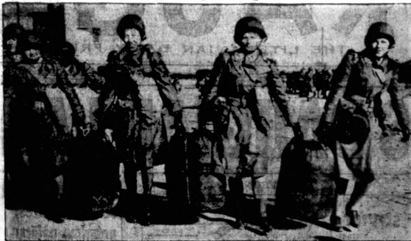
Pirmosios W. A. A. C.'s buvo pasistoję į priekį, jos su daugybe pasistojusių išvykti iš Amerikos. Šios W. A. A. C.'s bus priskirtos prie Lt. Gen. Dwight Eisenhower štabo, Afrikoje.

čias sielas paguos: Suteik jiems, o Viešpatie, Amžiną atilaj.