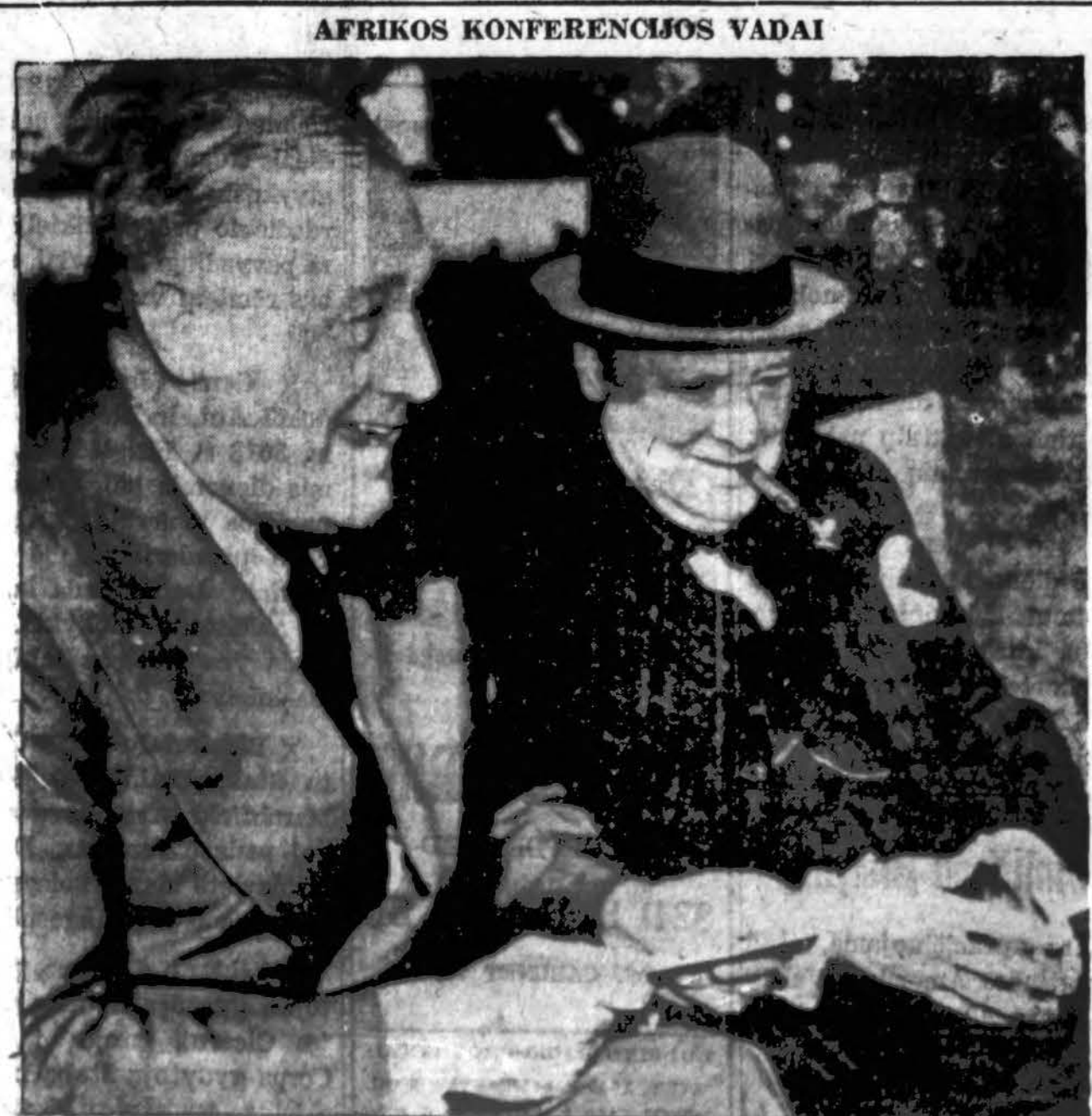
Prezidentas Roosevelt ir britų ministeris pirmininkas Churchill džiaugiasi sekmingu pasisekimu istoriškai 10 dienų konferencijos Casablankoje.

Vienintelis ir Smagiausias Vakarinis Lietuvių Programas Amerikoje — VIENUOLIKTI METAI! — SEKMADIENIAIS 1 val. p. p. KIDOMIS Dienomis 9:30 v. vak. PENKTADIENIAIS 7 v. v. Phone: GR09ehill 2242 WHFC-1450 kil.