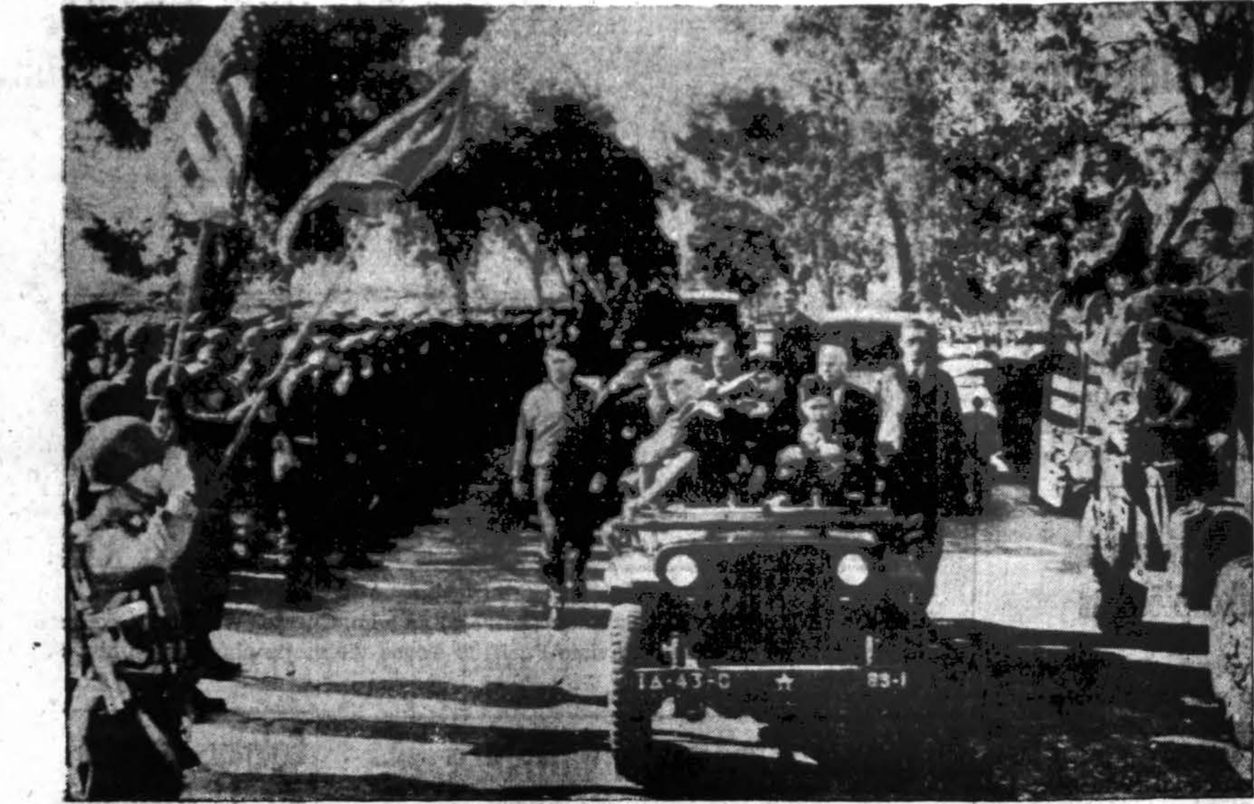
Prezidentas Roosevelt atiduoda pagarbą vėliavai ir sveikina Amerikos kareivius prancūzų Moroccoje, laike savo atsilankymo š. Afrikoje.

Parodykime pasauliui, kad mes, būdami tikri lietuviai patriotai, įvertiname savo tėvų žemės laisvę ir nepriklausomybę. Parodykime pasauliui, kad mes norime, kad Lietuva būtų ir vėl išlaisvinta iš žiaurių priešų priespaudos. Užpildykime Orchestra Hall sekmadienį, vasario 14 d.