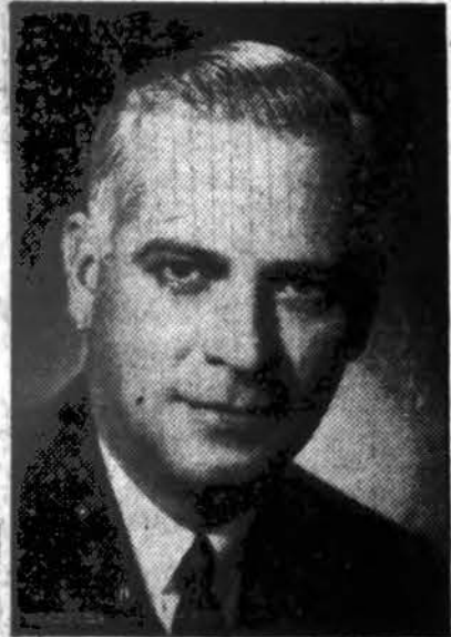
Gub. Dwight H. Green

SPRINGFIELD, ILL., Feb. 1.—Governor Dwight H. Green today issued a proclamation proclaiming Tuesday, February 16th, as Republic of Lithuania Day and commended its observance to all interested groups of citizens. The proclamation follows: