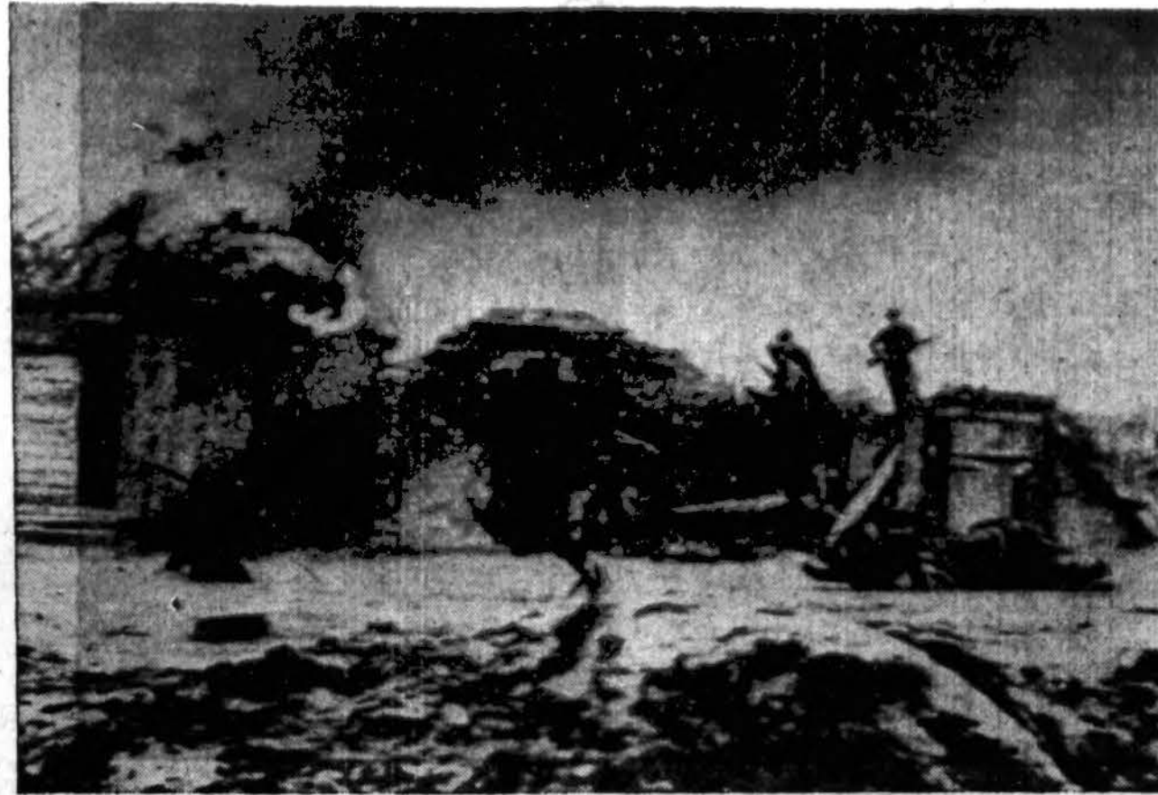
Rusų partizanai paėmė iš nacių — vengrų rusų kaimą. Čia matome kovos vaizdą.