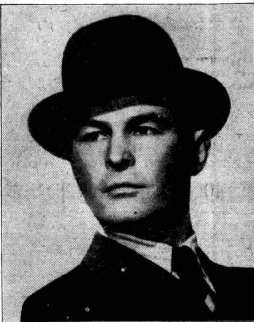
JAN KIEPURA, ŽYMUS DAINININKAS