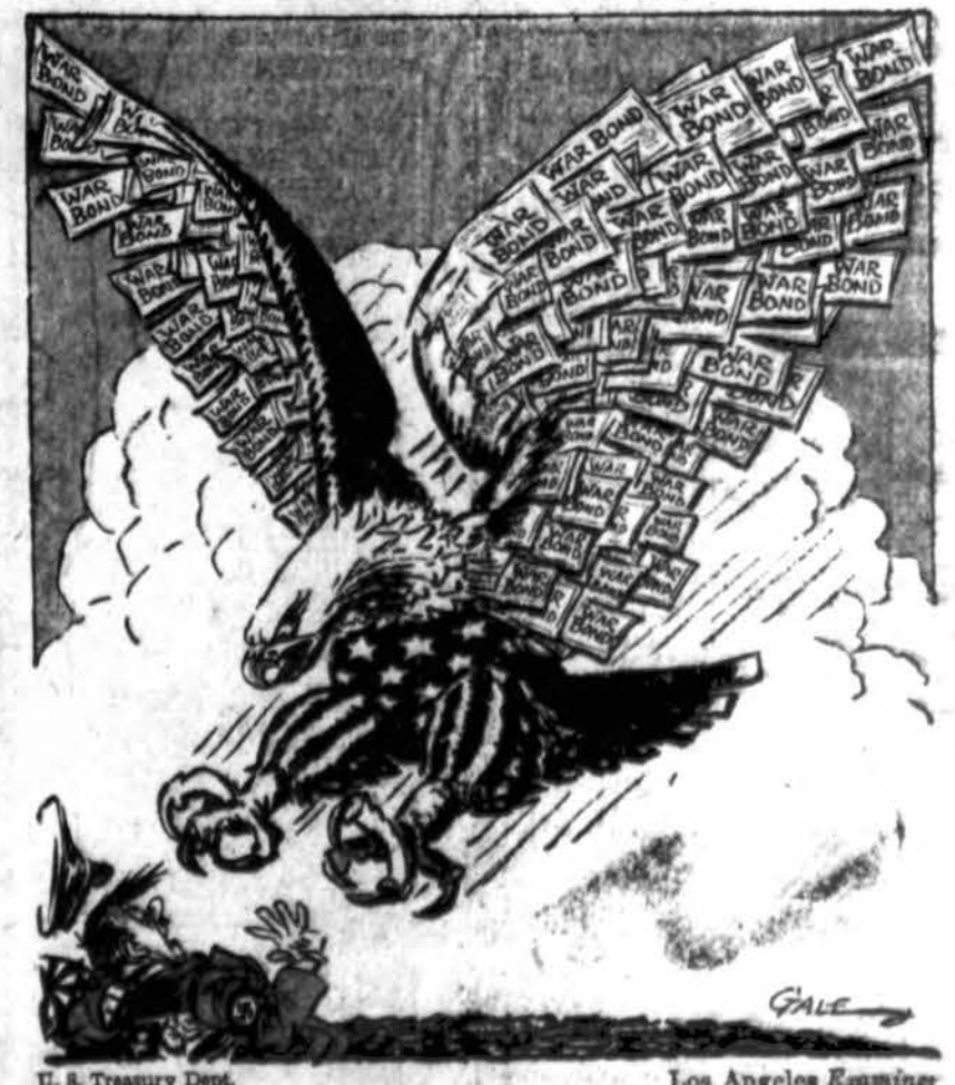
U. S. Treasury Dept. Los Angeles Examiner