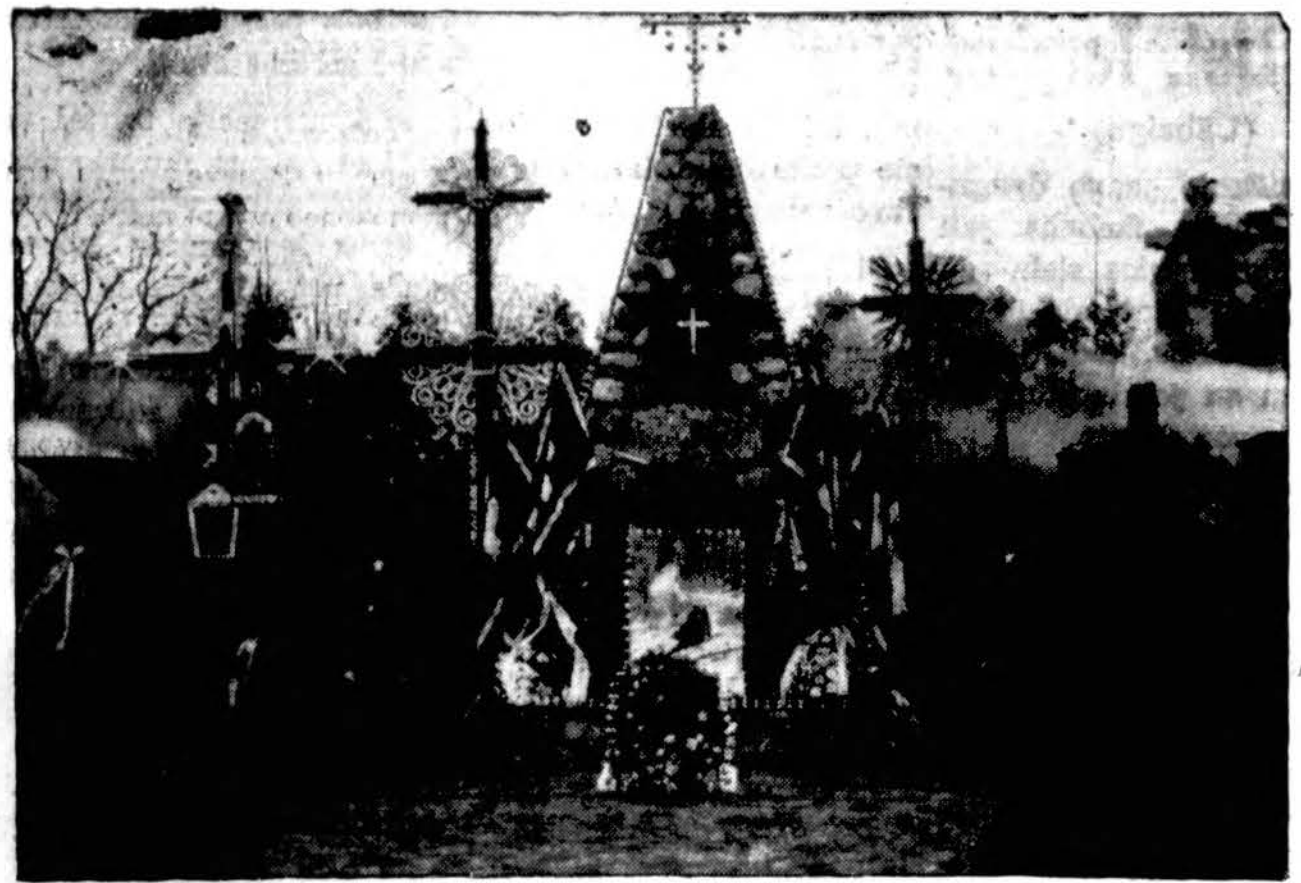
Nežinomojo Lietuvos kareivio kapas prie Karo Muziejaus Kaune.