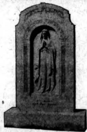
Mūsų pastatytas TEVAMS MARJONAMS

MODERNI Išvadinė PARODA: REZIDENCIJA: 4535 W. Washington Blvd. 5919 South Troy Street Tel. ESTebrook 3645 Tel. REPUBLIC 4298 VALANDOS: Kasdien 9-9 v. vak.; Šeštad. ir Sekm. 9-6 val.