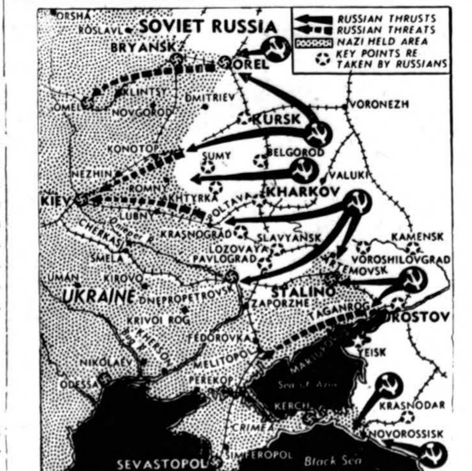
Tarp rusu ataku ir pramatytu ataku iš pietu Orel, nacių fronto linija tikrai tirpsta.

Seimas nuoširdžiai dėkoja TT. Marijonu Bendradarbiu centro valdybai, visiems skyriams, veikėjams, aukotojams, seimo vadovybei ir rengėjams. Taip pat dėkoja visiems kunigams klebonams ir už rodomą palankumą TT. Marijonu Bendradarbiu veik lai.