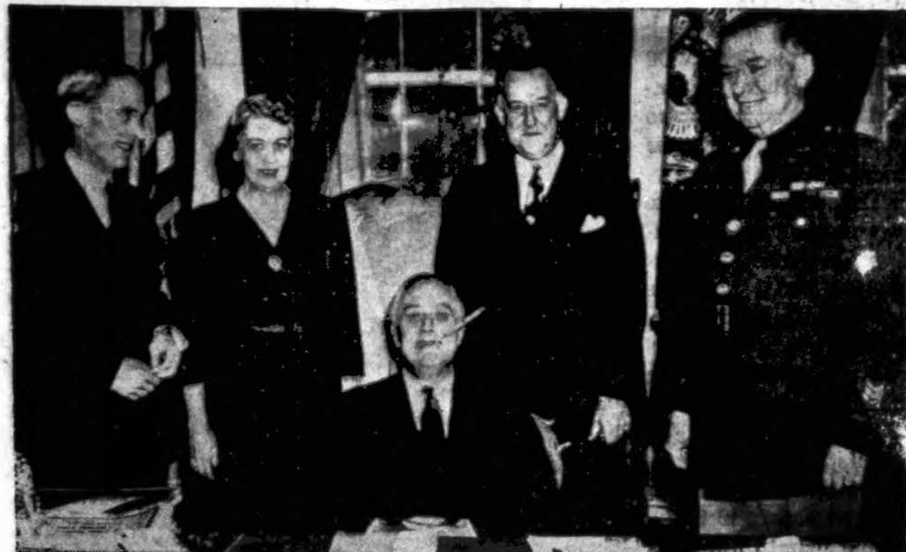
Prezidentas Rooseveltas švenčia su savo ofiso bendradarbiais dešimt metų sukaktį Ižengė į vienuoliktus metus. Iš kairės į dešinę sekretoriai: Marvin McIntyre ir Miss Grace Tully, prezidento sekretoriai; sekretorius Stephen Early ir Maj. gen. Edwin Watson, FDAR's Military Aide.