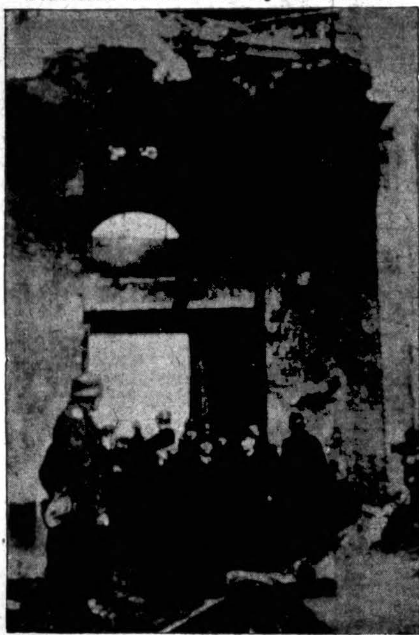
Ypatinga radiofoto gauta iš neutralių šaltinių. Čia matome dr. Paul Goebbels (šviesiu viršutiniu palto centre) apžiūri šv. Jadvygos katedros sužalojimus Berlyne, didžiausią katalikų bažnyčią, kuri yra netoli miesto centro. Sužalojimai įvyko po to, kai RAF smarkiai bombardavo Berlyną, kovo 1 dieną.