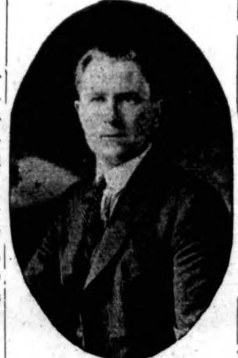
Vienas issivadavo, kitas mirė

Lietuviu kataliku labdariu ūky Holy Family Villa (Orland Park, Ill.) kovo 5 d. įvyko nelaimė.