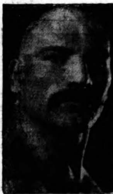
"Iron Man" Talun

Dariaus-Girėno postas American Legion rengia antros ristinės savo salėj, 4416 S. Western Ave., ketvirtadienio vakare, kovo 11 dieną. Šį kartą savo programoj tu-