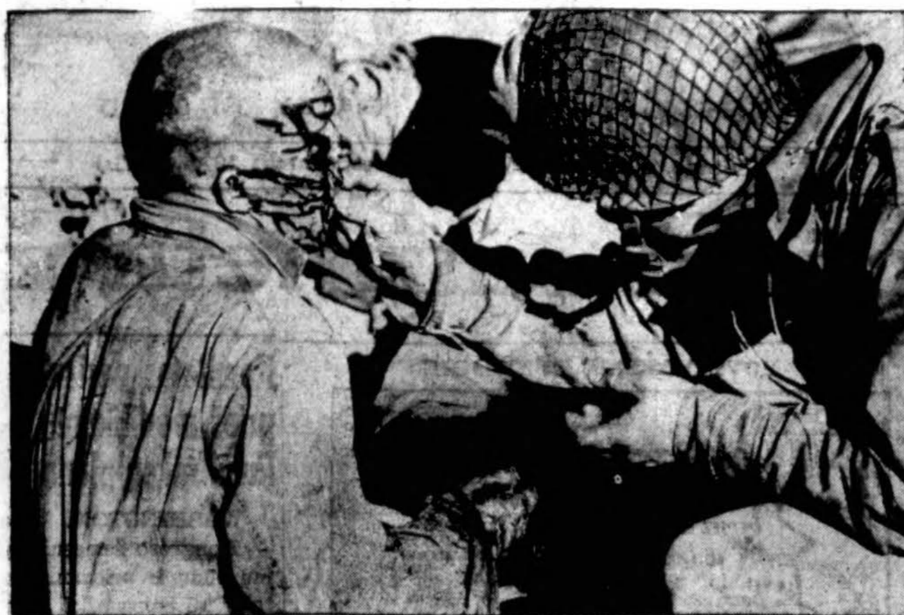
"Draugas" Acmo photo. Sužeistas kareivis bando imti vaistų iš savo draugo. Abu dalyvavo Sened kovoje, kur vyko strateginė kova dėl gelžkelio Centralinėje T. nisijoje, kuri kelis kartus mainės iš vienu rangu į kitas.