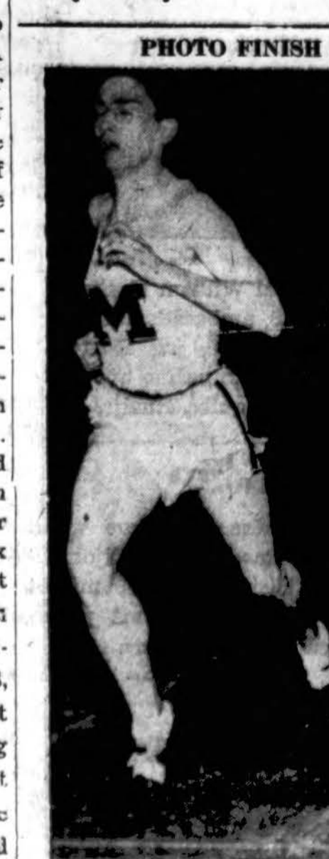
PHOTO FINISH AT END OF MILE