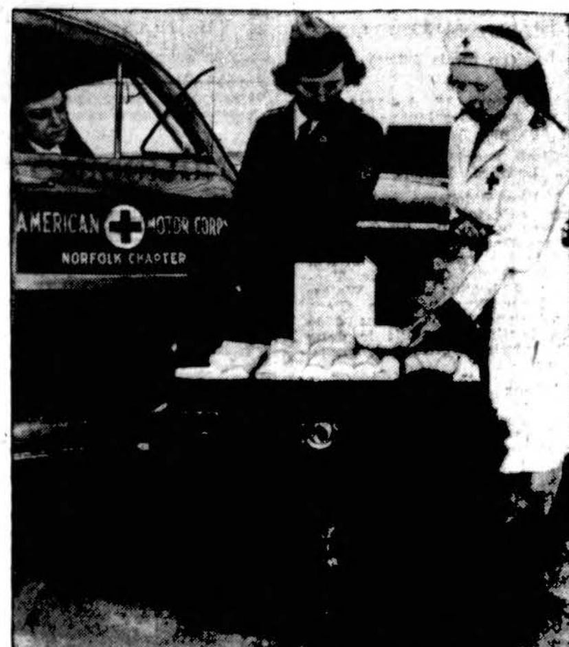
PREPAREDNESS—Red Cross Motor Corps and Production Corps volunteers examined a trunk filled with surgical dressings and other supplies held in reserve for use in the event of disasters from natural causes for enemy action. Such supplies are being stocked in strategic areas throughout the county as part of the Red Cross emergency preparedness program.

Didis žmogus daug reikalauja iš savęs, o mažai iš kitų.