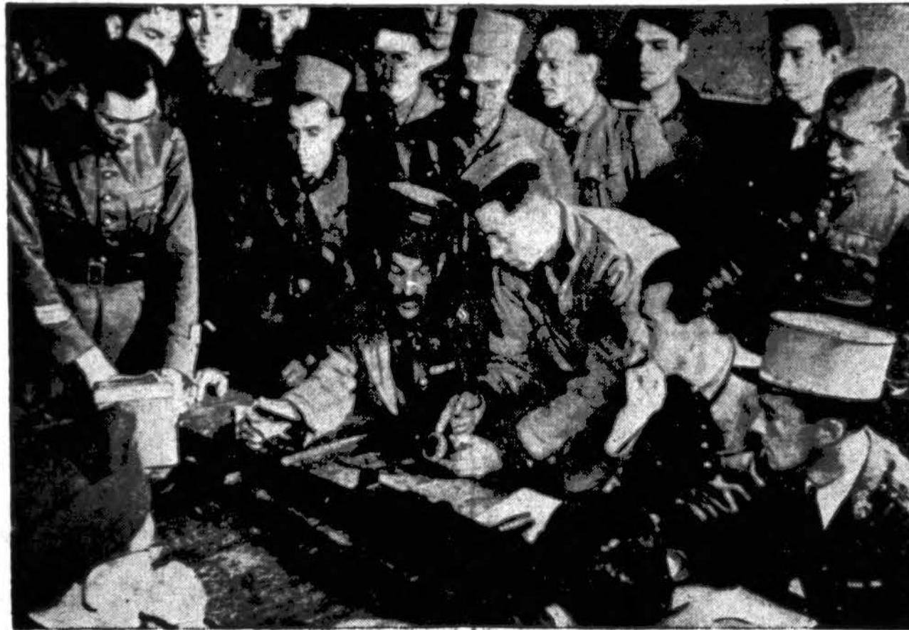
Prancūzų Armijos karininkai ir kareiviai Š. Afrikoje instrukuojami kaip vartoti U. S. Armijos ginklus. Prancūzai atydžiai klausosi Amerikos corporal nurodymų kaip išardyti ir sudėti .50 kalibro machine gun.