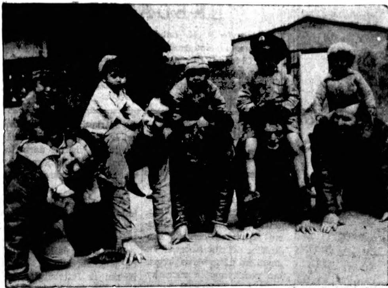
Apokėdami už maistą ir gyvenimo vietą, šie penki Amerikos kareiviai Kinijoje "isūnino" penkis Burmos vaikus. Sakoma, jog tai paprastas reiškinys tarp Amerikos kareivių Kinijoje. Tai rodo kareivių žmoniškumą.