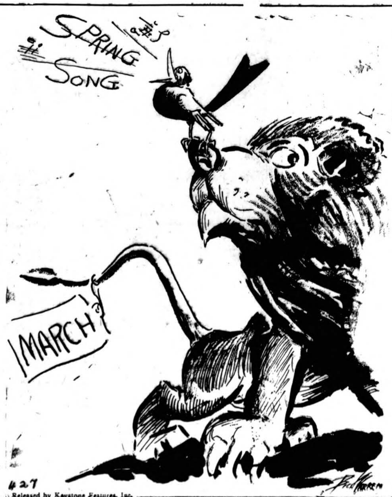
427 Released by Kaytons Features, Inc.

Mikas: — Kai vienam tippui pasiūliau noris parduoti Washington tiltą, tai užuot tiltą parduoti, man kainavo $25.00, kad kostiumeris nepraneštų policijai, kai reikėjo jam įrodyti, jog tas tiltas yra tikrai mano.