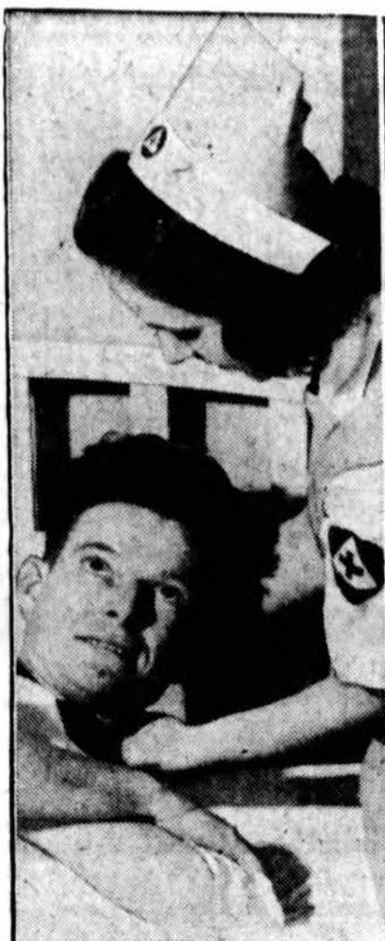
BIG JOB —Now serving in facilities of the U. S. Veterans Administration as well as civilian hospitals, Red Cross Volunteer Nurse's Aide are daily becoming essential to the war effort at home. More than 50,000 of these women are prepared to give their time to this work, relieving trained nurses from routine duties and thereby helping to alleviate the nursing shortage in hospitals.

Pelikonai čia atskrenda, pabūna keletą mėnesių ir vėl išskrenda. Miesto sodo šone Biscayne randasi laivų priplauka, iš kurios įvairios laivų bendrovės laivais vežioja vasarotojus į įdomias vietas jūrų pakrantėse. Pelikonai yra jaukiausieji paukščiai, kokius kada mačiau savo gyvenime. Pilkai-rudos spalvos, ilgu snapu ir kaklu, juodomis letenomis, mažos