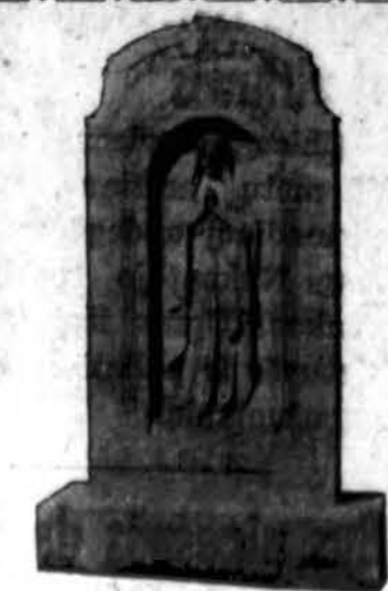
Mūsų pastatytas TEVAMS MARIJONAMS

DIDYSIS Ofisas ir Dirbtuvės: 527 N. WESTERN AVE. (Netoli Grand Ave.) PHONE: SEELEY 6103