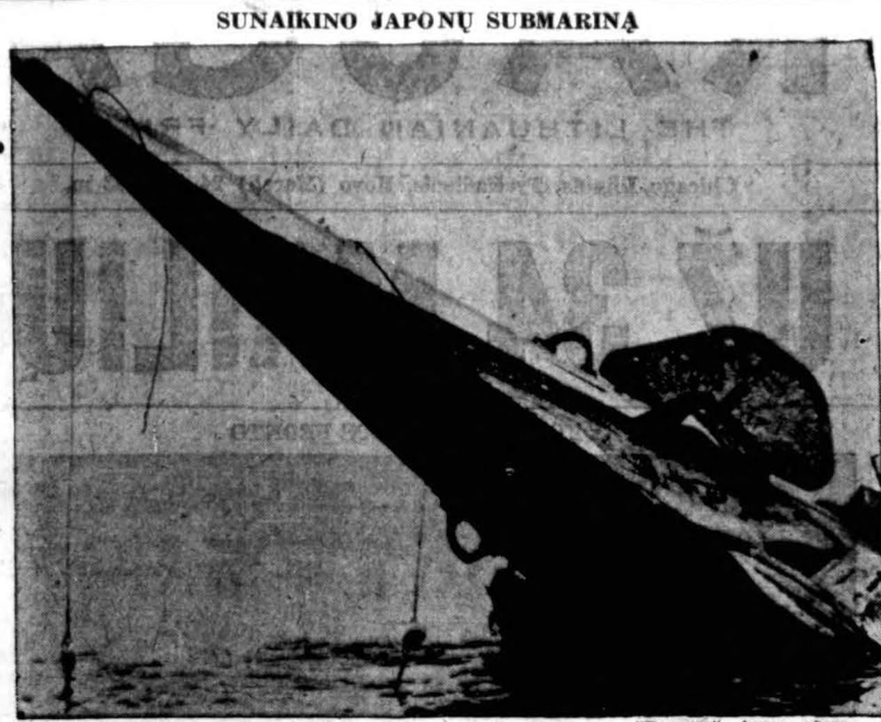
Japonų išsikišęs submarinas iš vandens. Šis japonų submarinas buvo sunaikintas dviejų New Zealand laivų (corvettes), Guadalcanal vandenynė. Japonų submarinas buvo paskandintas, kai jis bandė pulti sąjungininkų transporto ir rekmenų laivus.

Visi Chicago gyventojai, taigi ir lietuviai, yra susirūpinę sukėlimu 40 milijonų dolerių pastatymui kreiserio vardu Chicago, kuris buvo nuskaudintas japonų Pacifiko vandenynė. Pirkti bonai iki šio mėnesio 28 dienos eis į "Cruiser Chicago Fund".