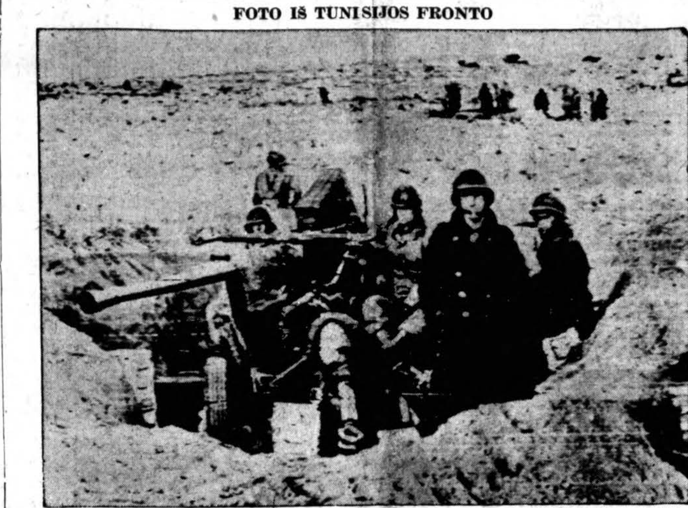
FOTO IŠ TUNISIJS FRONTO

Prieš Smolenską rusai veržiasi dviem kolonomis. Viena kolona jau pasistūmusi už 20 mailių nuo Yar-