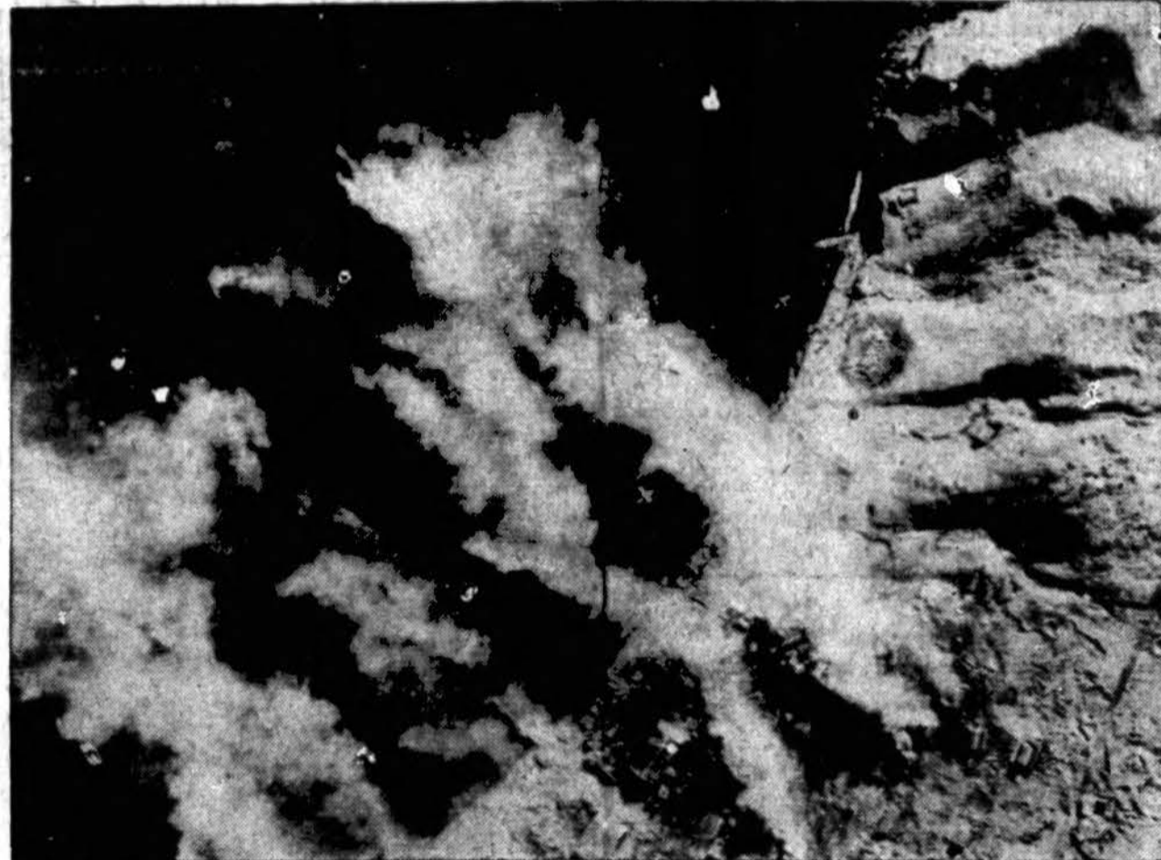
Nepaprasta ugnis kyla iš japonų jūrų lėktuvų trobesių Kiska saloje, kur U. S. Army Air Force bombardavo japonus.