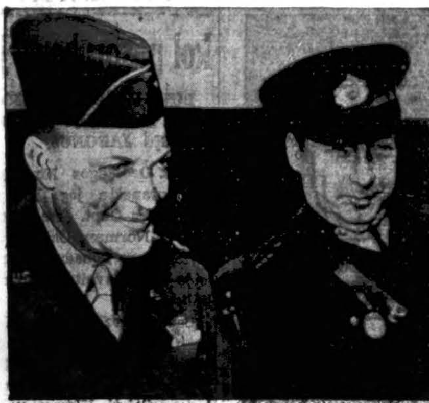
Gen. Dwight Eisenhower konferuoja su turkų generolu Salhi Omurtak. Turkų militarinė misija dabar lanko są- jungininkų jėgas Algerijoje. Šis paveikslas buvo pasių- tas per naują U. S. Signal Corps radiotelephoto.