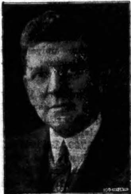
Mayor Edward Kelly

Marquette Park Lietuvių Demokratų Masinis Susi- rinkimas del Majoro Ed- ward J. Kelly, įvyks Sekma- dienį, Kovo 28 d., 2 val. po- piet, Gimimo Švenė. Panelės Marijos parap. salėje, 68th ir Washtenaw Ave.