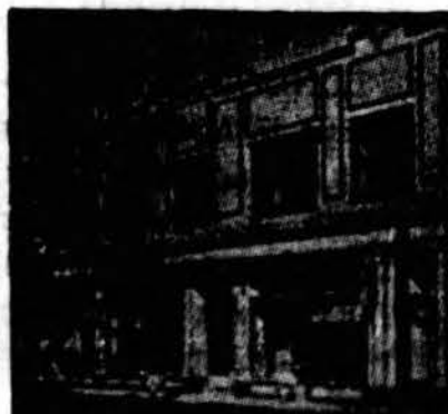
Budriko Didelė Krautuė

Pirkite čionai, nors jūs gyvenate ir 150 mialiu nuo Chicago! Mes turime pilną pasirinkimą namams rakandų, karpetų, matrasų, springų, elektrinių dulkių valytuvų, garsių ir anglinių pečių, įvairių bedroom setų, dnette setų, vaikams lovelių, paduškų, kaldrų, blanketų, radijų, rekordų, "jewelry", deimantinių žiedų, auksinių žiedų, laikrodžių ir plunksnų britvų. Čionai taip pat rindasi Optical departmentas ir Paint departmentas. Kainos yra prieinamos; niekur kitur geriau negausite.