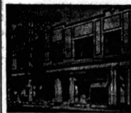
Budriko Didelė Krautuvė

Pirkite čionai, nors jūs gyvenate ir 150 mylių nuo Chicago! Mes turime pilną pasirinkimą namams rakandų, karpetų, matrasų, springų, elektrinių dulkių valytuvų, garsių ir anglinių pečių, įvairių bedroom setų, dinette setų, vaikams lovelių, paduškių, kaldry, blanketų, radijų, rekordų, "jewelry", deimantinių žiedų, auksinių žiedų, laikrodžių ir plunksnų britvų. Čionai taipgi randasi Optical departmentas ir Paint departmentas. Kainos yra prieinamos; niekur kitur geriau negausite.