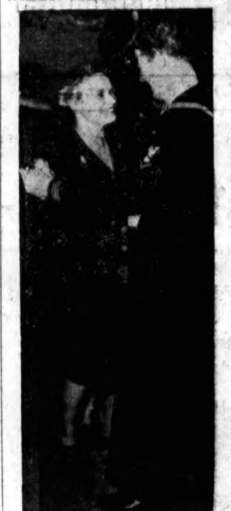
Col. Oveta Hobby šoka su, Washington, D. C.