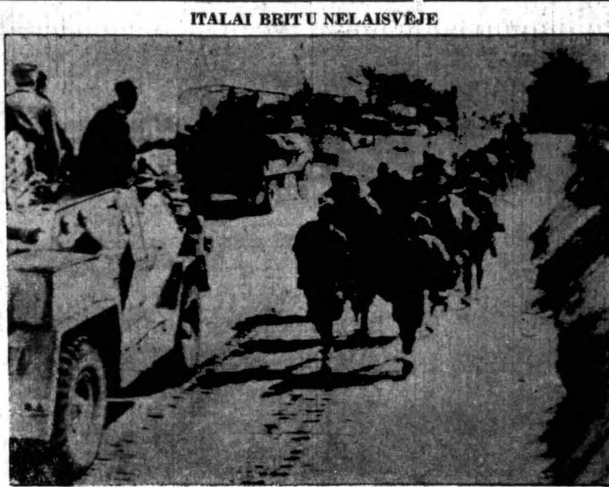
Vaide matosi kaip dalys britų 8-tos kariuomenės trokai pralekia pro Italijos nelaisvėje eiles, kurias britai sučiupo vydami Rommelį arti El. Guettar, Afrikoje.

RUSIJA.—Sovietų vadovybė praneša, kad kai kuriose fronto dalyse vokiečiai pakyla į kontratakas. Bet rusai visur juos atmuša.