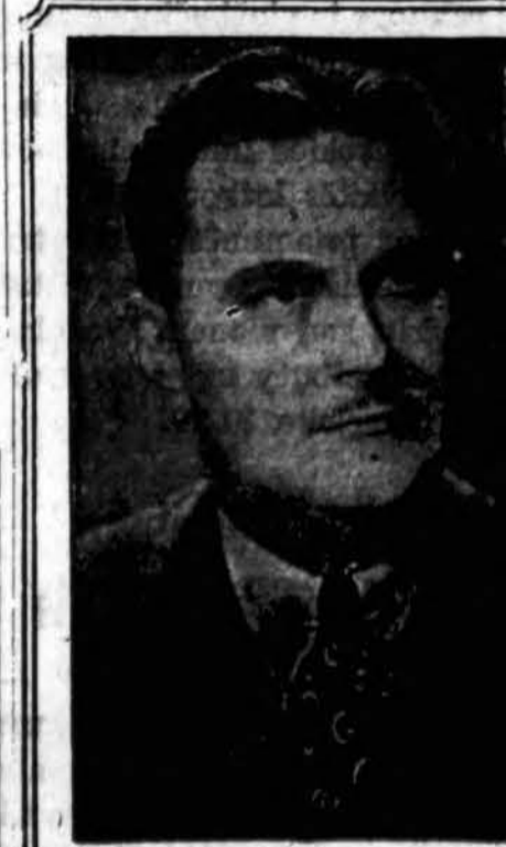
WOLK STUDIO 1945 West 35th Street