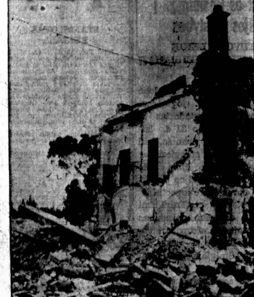
Paveikslas rodo vienuolyną Algerijoje, kur penkiolika vienuolių buvo užmušta ir trys sužeistos, kai nacių bomba pataikė į namą. 60 našlaičių vaikų buvo išgelbėta. Jie buvo rūsyje.