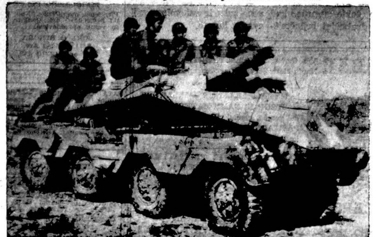
"Draugas" Acme photo

Šis tankas naikintuvas buvo paimtas iš vokiečių. Tankas apginkluotas 75 mm patranka ir jis gali veikti pirmyn ir atgal.