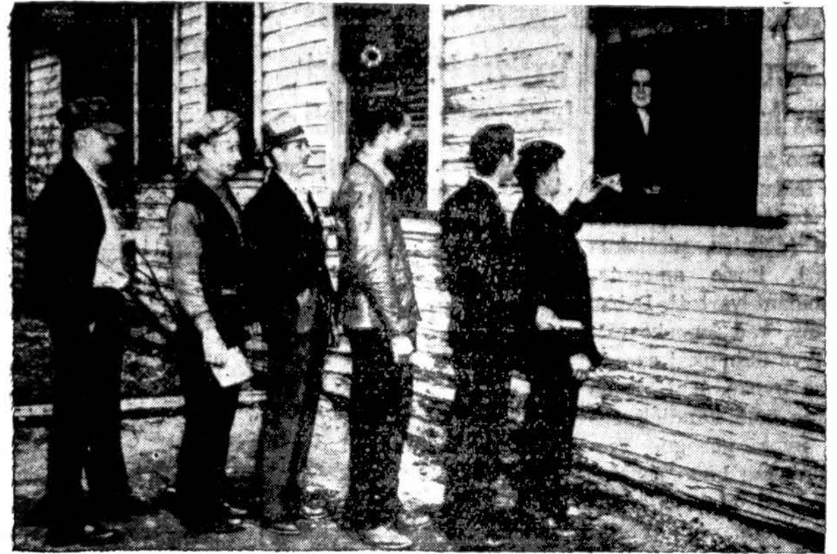
Rickeyville, Pa., mainose vyko streikas. Anglių kasykloje tylą kaip kape. Čia matome streiko vaizdą.